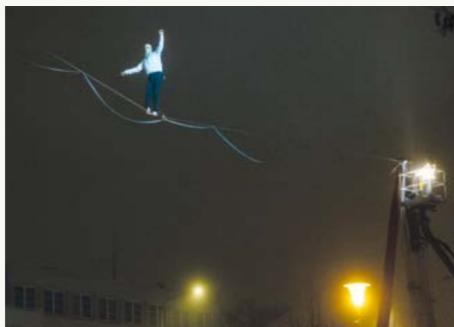
Baroko v srdci Připomínka 300 let od úmrtí architekta Jana Blažeje Santiniho-Aichela vyvrcholila provazochodeckým a akrobatickým vystoupením.