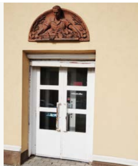
Poslední luneta, bývalý obchod s masem