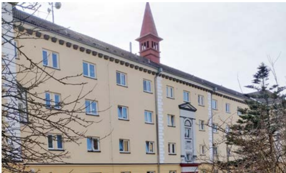
Dům s věžičkou