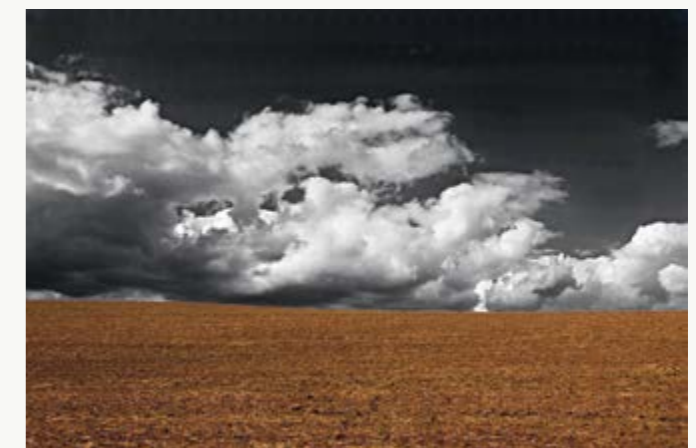
2. – 3. místo veřejnost – Mračna