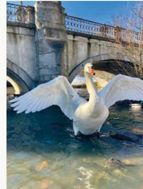
1. místo veřejnost - Labuť v Zámku

Výstava všech 12 fotografií, které postoupily do celoročního hodnocení, bude v Malé galerii ve Staré radnici k vidění do 14. ledna. Srdečně vás zveme!