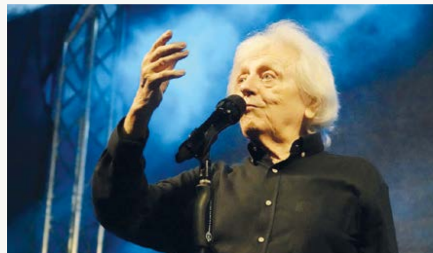
Václav Neckář na Horáckém džbánku