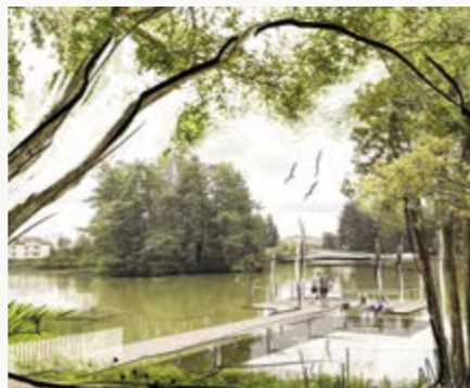
Velký žďárský rybník vizualizace

Stav: příprava Realizace: 2024 Náklady: 68 mil. Kč Dotace: 34 mil. Kč Fotbalový stadion by se mohl dočkat rekonstrukce kabin a nového trávníku, tenisové kurty