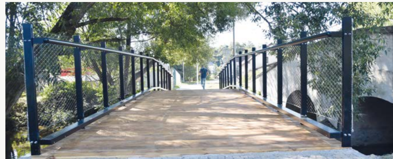
Lávka ve Dvorské ulici