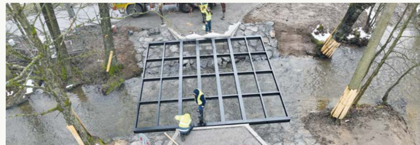
Ocelová konstrukce lávky Táferna

Letos se město pustilo také do rekonstrukce mostu na Strojírenské. Rekonstrukce za téměř 12 milionů korun s DPH výrazně prodlouží životnost mostních konstrukcí. Firma vyměnila celý svršek mostu, naopak spodní stavba a nosná konstrukce prošla celoplošnou sanací. V místě přibyl i přechod pro chodce a cyklisty, nový je i povrch silnice až ke křižovatce s Revoluční.