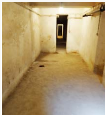
Enfláda v krytu pod II. ZŠ

V roce 1949-50 vzniklo na Vysočině nové město. Byl jím po sloučení dvou obcí, tedy Města Žďáru s 3 548 obyvateli a Zámku Žďáru s 683 obyvateli, Žďár nad Sázavou. Prvním předsedou Městského národního výboru nového města byl Václav Ježek. Bylo rozhodnuto oživit region výstavbou nového průmyslového závodu. Nejprve se uvažovalo o výstavbě obuvnické firmy, pobočky třebíčské firmy Dekva. Nakonec bylo rozhodnuto o vybudování nového strojírenského a metalurgického závodu s názvem Žďárské strojírní a slévárny. Současně s výstavbou ŽĐASU započala stavba sídliště pro jeho zaměstnance.