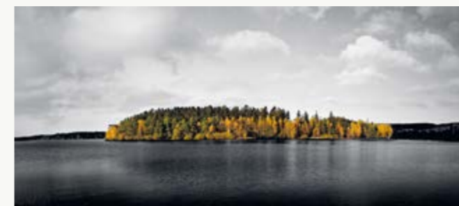
1. místo odborná porota – Ostrov barev