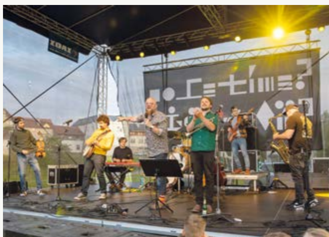
Den Žďáru Tradiční oslava Dne Žďáru přinesla program pro děti, koncerty a také propojení s výstavou Kouzlo objevování.