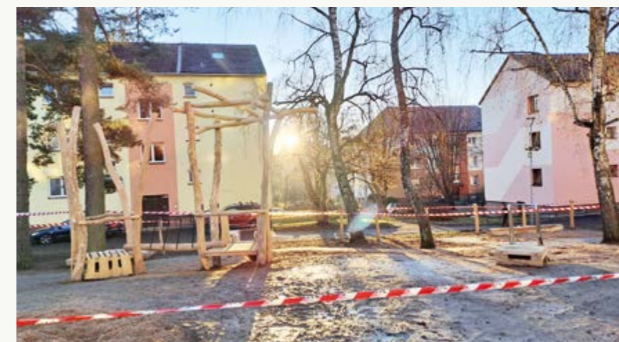
(red) Na jaře se hřiště dočká úpravy ploch a osetí travou

Hlavní dominantou otevřeného a přehledného hřiště na kopečku je hrádek z akátových kůlů se skluzavkou, průlezem a síťovým mostkem. Z hrádku vede delší skluzavka, vedle je další pro menší děti. Herní prvky doplňuje houpačka a pískoviště. Hřiště posazené do svahu je navrženo pro nejmenší děti, tomu jsou svou velikostí a obtížností přizpůsobené i herní prvky. Náklady jsou zhruba jeden milion korun s daní.