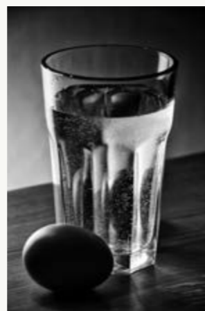
3. místo odborná porota