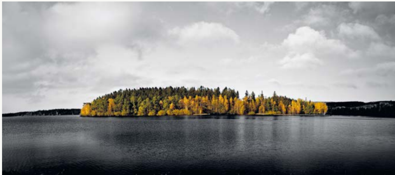
1. místo odborná porota - Ostrov barev