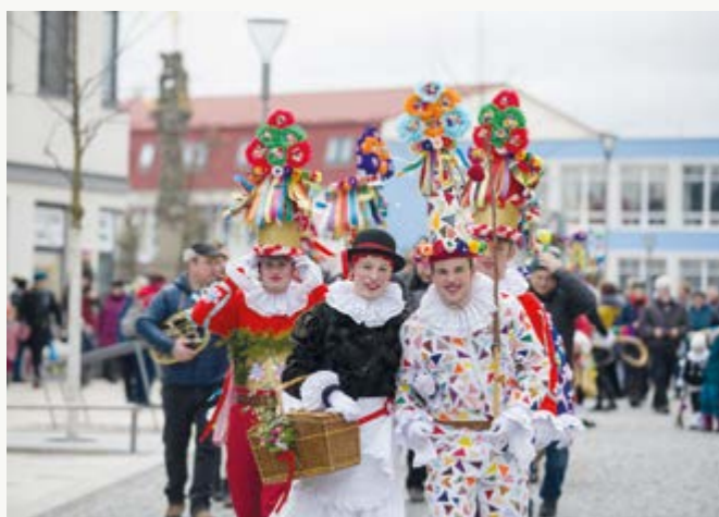
Maškary jdou! Premiérové vystoupení tradiční maškary ze Studnic na Hlinecku s sebou přineslo veselí, akci ukončilo symbolické stínání kobyly.