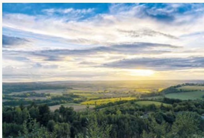
2. místo odborná porota - Vyhlička Štikov