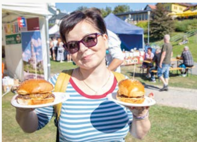
Futrování na Farských Už tradiční akce v parku na Farčatech nabídla rozmanité lahůdky z celého světa, ale i koncerty a další program.