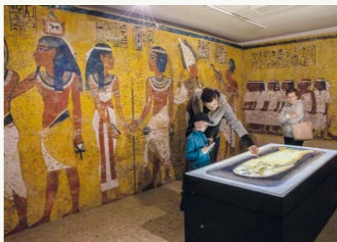
Muzejní noc Hojně navštěvovaná výstava Kouzlo objevování: Od hieroglyfů k Tutanchamonovi se propsala i do muzejní noci.