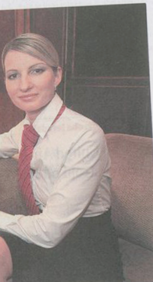
...ovat firmu před porotou soutěže.

Ale nejde o to, že někam půjdete a ažite opravdu chovat, říká.