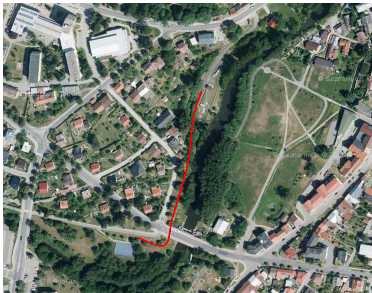
Situační (stezka 1. Máje)