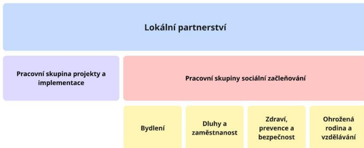
Obrázek 3 Realizační struktura PSZ

Přípravu dokumentu Plán sociálního začleňování III. řídí, monitoruje a schvaluje Lokální partnerství, které se schází min. 2x ročně.