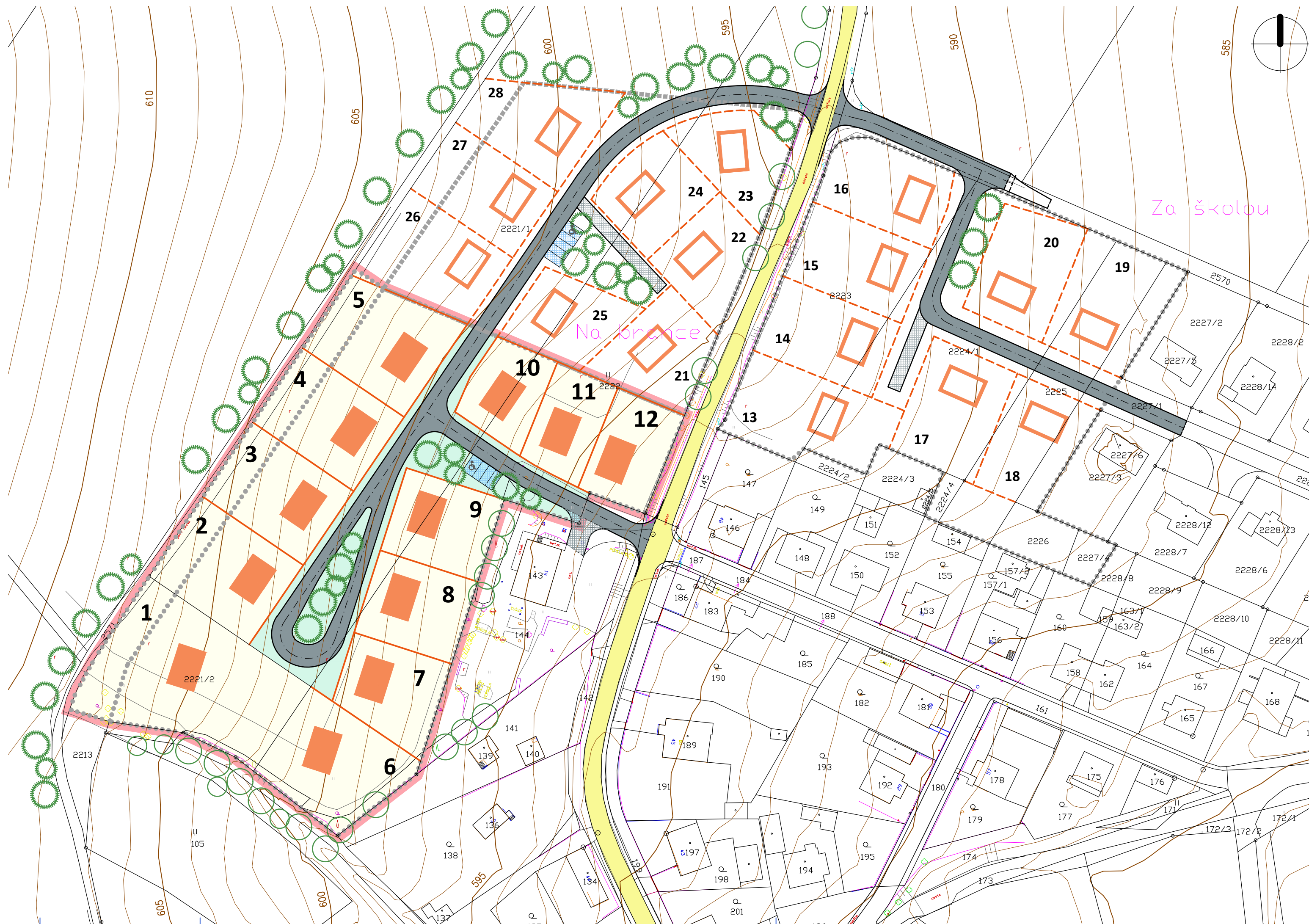
TABULKA BUDOUCÍCH STAVEBNÍCH POZEMKŮ