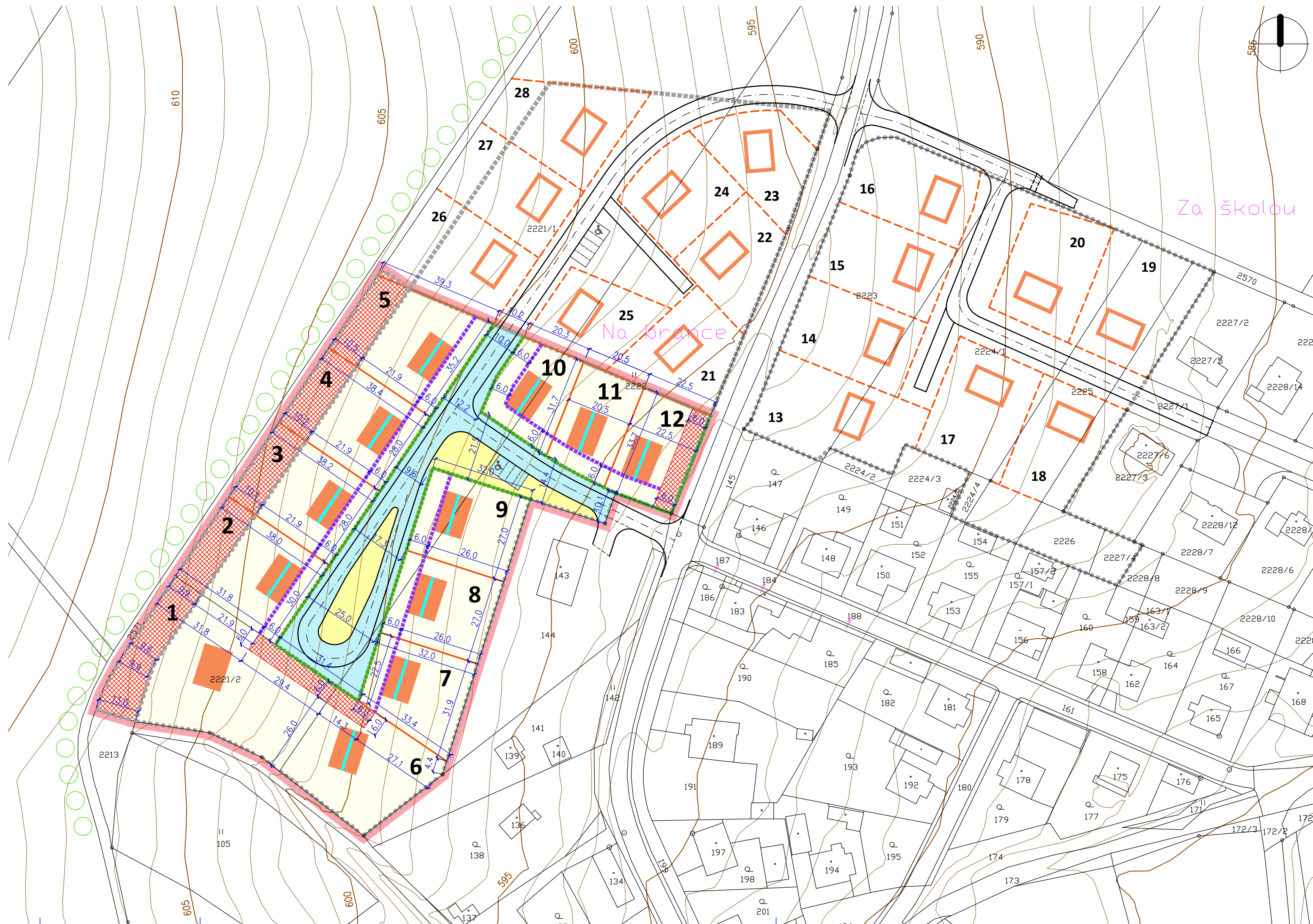
TABULKA BUDOUCÍCH STAVEBNÍCH POZEMKŮ