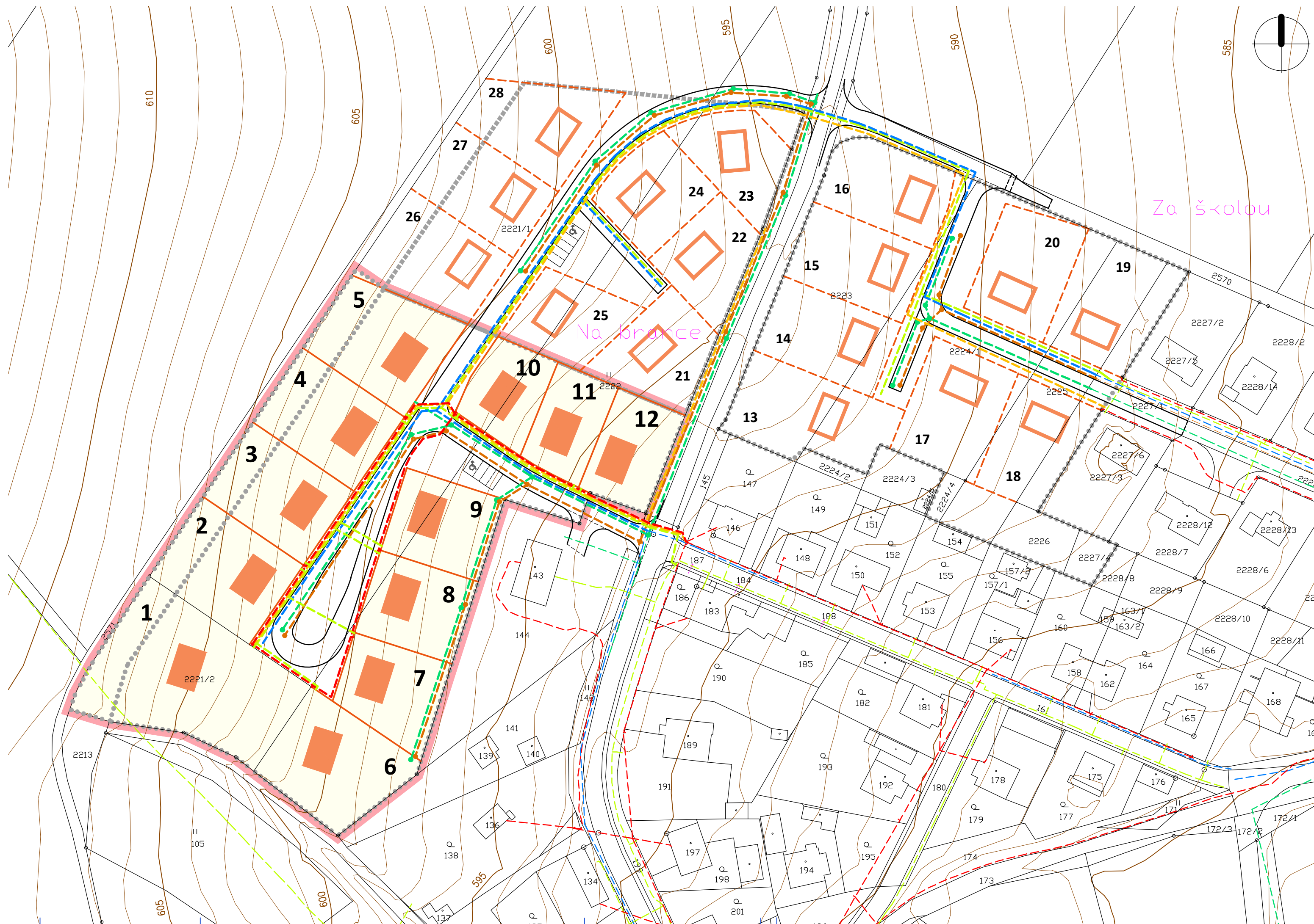
TABULKA BUDOUCÍCH STAVEBNÍCH POZEMKŮ