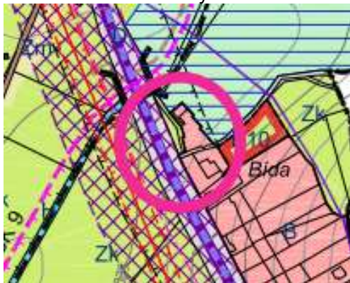
Záměr č. 3 - výřez

Problémy: Dosud je využito pouze cca 20 % v ÚP vymezených zastavitelných ploch smíšených obytných. Zamýšlená plocha by přímo navazovala na areál zemědělské živočišné výroby. Severní cíp pozemku p. č. 208/9 se nachází v ZPF první třídy ochrany. Pozemek p. č. 605 se nachází mezi komunikací v majetku obce Karlov a plochou silnice I/37. Jedná se o úzký pro výstavbu rodinného domu nevhodný tvar pozemku u silnice s vysokou intenzitou dopravy.