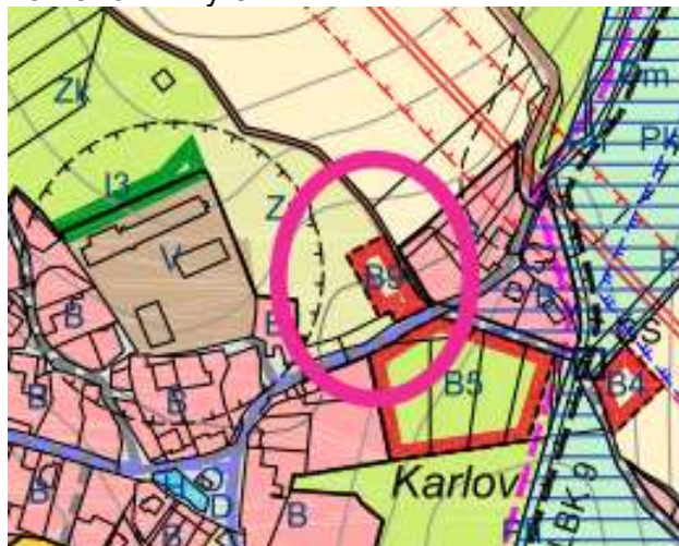
Záměr č. 1 - výřez

Záměr č.2: Vyjmutí navrhované místní komunikace č. 22 a vyjmutí účelové komunikace č. 24 z konceptu ÚP. Jedná se o části pozemků p. č. 621/1;621/2; 672/1; 73/8; 88/18; 691/8; 89/9.