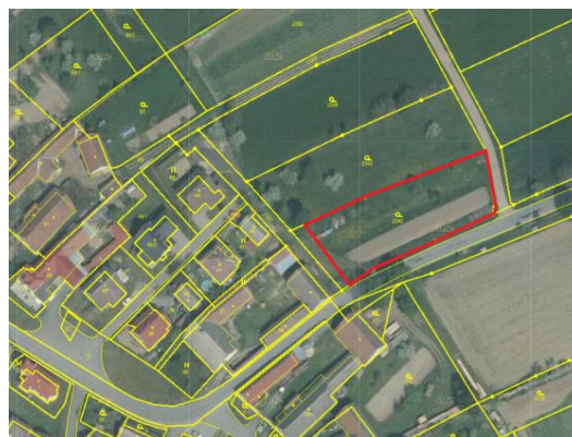
Návrh č. 3 v ortofoto