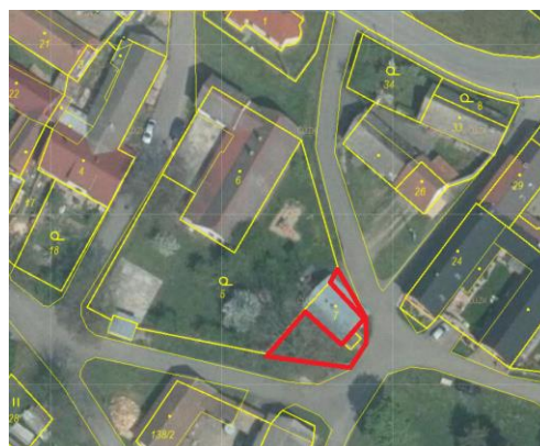
Návrh č. 2 v ortofoto