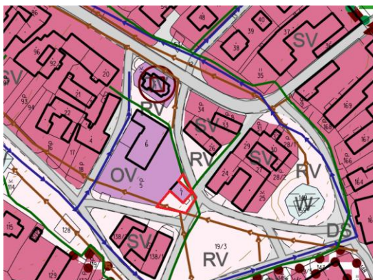
Schéma: Návrh č. 2 v územním plánu

Využití v platném ÚP – na pozemku je stávající stabilizovaná plocha „Plochy veřejného prostranství (RV)“. Pozemek se nachází v zastavěném území obce, v sousedství obecního úřadu a stávající hasičské zbrojnice. Pozemek je přístupný z veřejné komunikace. Výměra plochy je cca 200 m 2 .