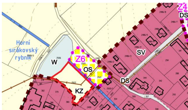
Schéma: Návrh č. 5 v územním plánu