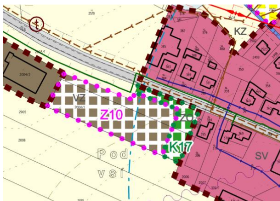
Schéma: Návrh č. 1 v územním plánu

Využití v platném ÚP – na pozemku je vymezena zastavitelná plocha Z10 „Výroba a skladování – zemědělská a lesnická prvovýroba (VZ)“, v sousedství jsou pozemky stávající chovné farmy a návrhová plocha pro „Zeľeň – ochrannou a izolační (ZO)“. V plochách VZ jsou jako nepřipustný způsob využití uvedeny mj. stavby pro bydlení.