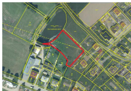
Návrh č. 5 v ortofoto