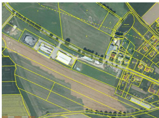
Schéma: Návrh č. 1 v ortofoto