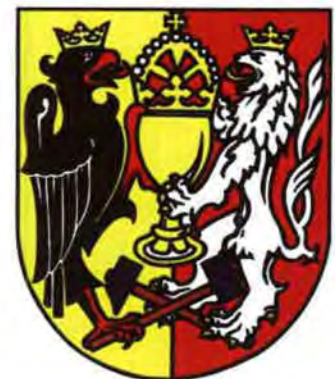
61. Kutná Hora