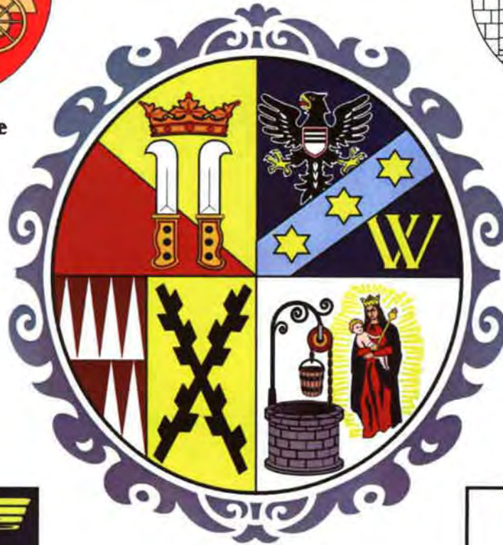
56. Žďár nad Sázavou