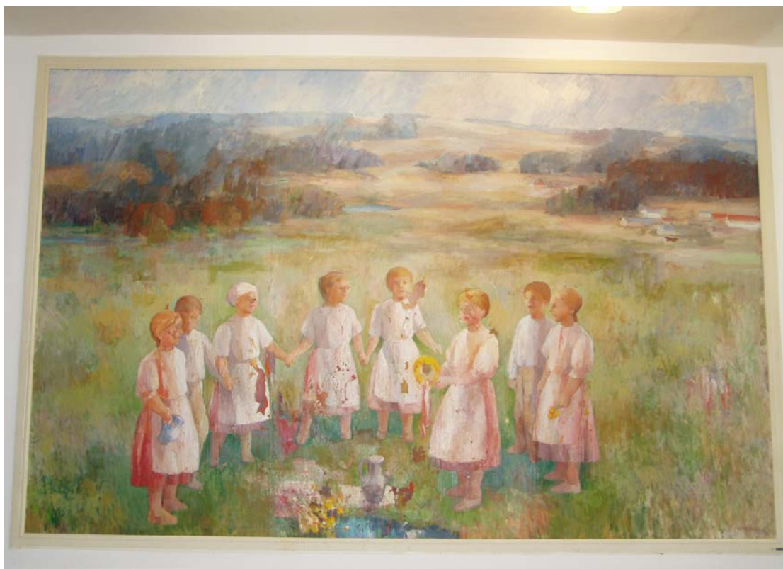
Celkový pohled na dílo před restaurováním

Obraz je namalován technikou oleje na plátně, nataženém na slepém rámu bez úkosu na vnitřní hraně, což se projevuje prolisem hrany na plátně. Barevná vrstva je silně zkrakelována a na mnoha místech zcela chybí, což dílo esteticky narušuje. Na partiích figur je poškození největší, pravděpodobně způsobené mechanickým namáháním a údery do obrazu. Barevná vrstva je přesušená a lak strávený.