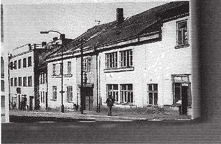
↳ Nadační dům Binkových (pоздěji Dům mládeže), stav ze tředesátých let 20. století (ARM, f. VF)