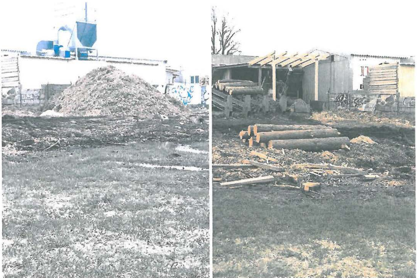
Obr. 9: Okolí pily, foceno 24. 3. 2019