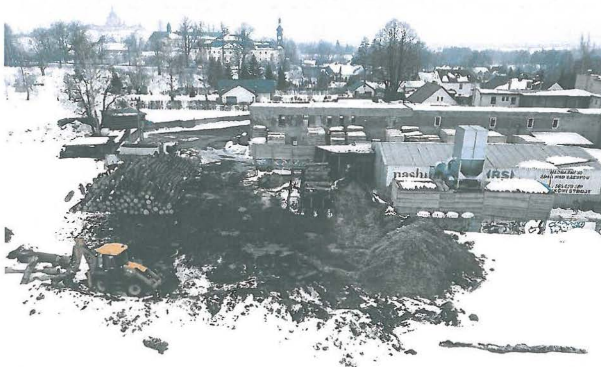
Obr. 6: Pohled na pilu a okolí, foceno dne 10. 2. 2019