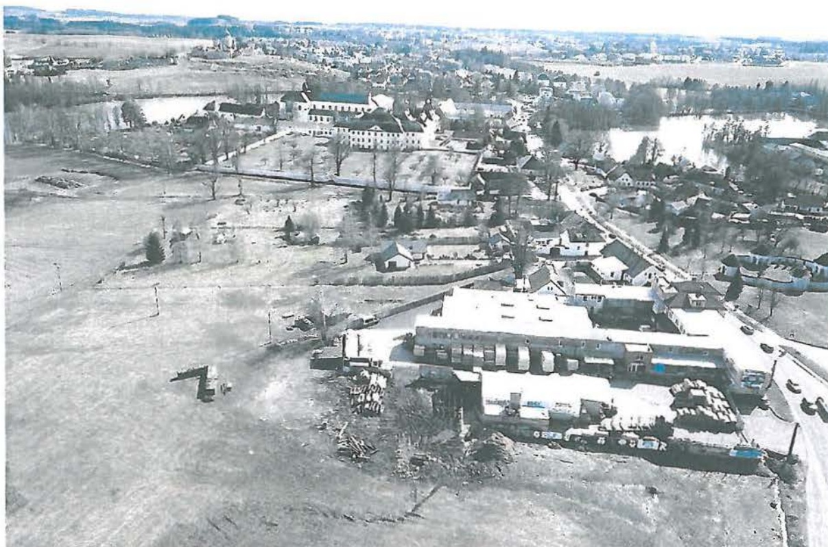
Obr. 7: Pohled na pilu a okolí, foceno dne 17. 3. 2019