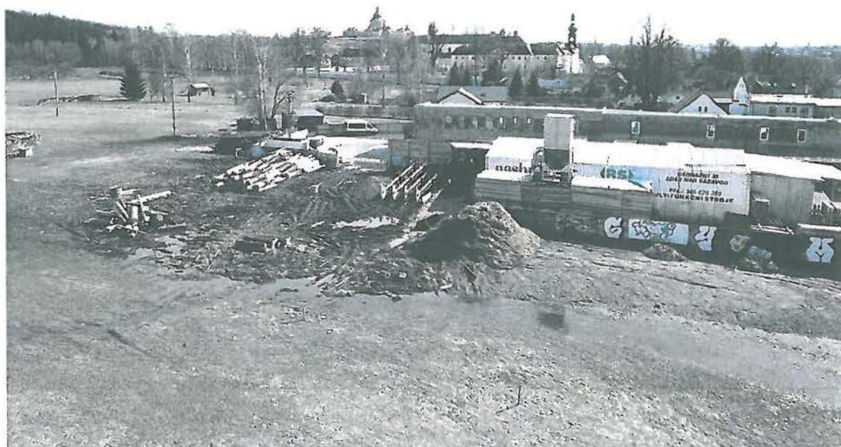
Obr. 8: Pohled na pilu a okolí, foceno dne 17. 3. 2019