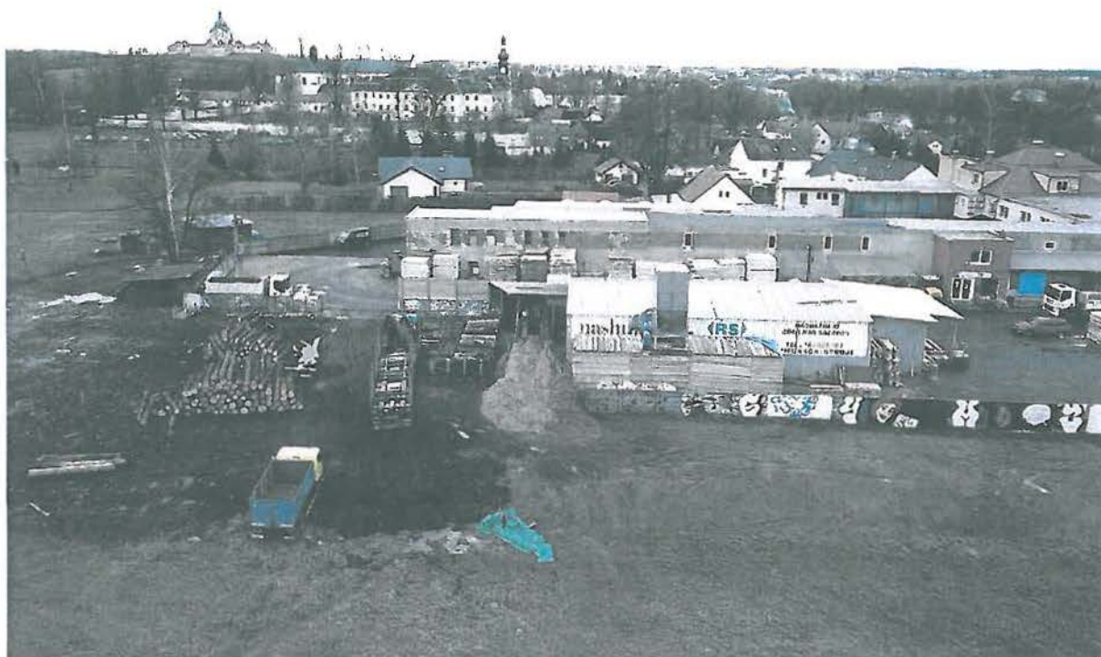
Obr. 5: Pohled na pilu a okolí, foceno dne 8. 12. 2018