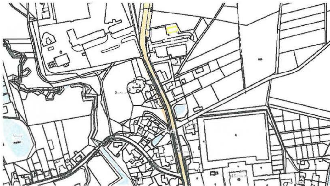
Obr. 1: Katastrální mapa (Katastrální území Zámek Žďár)

Vlastníkem těchto pozemků je pan František Kudrna.