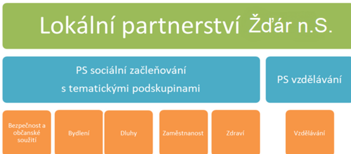
Obrázek 1 – Lokální partnerství Žďár nad Sázavou