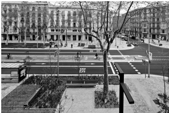
Passeig de Sant Joan, Barcelona, Španělsko, Lola Domènech

Je vhodné zúžit plochu vozovky. Podélná parkovací stání vydláždít kamennou dlažbou a doplnit o stromořadí. Je zde také prostor pro oboustranný koridor pro cyklisty.