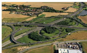
26 Vypracování dlouhodobého modelu financování dopravní infrastruktury