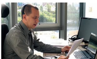
18 Digitalizace soudů