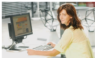
30 Národní infrastruktura pro zadávání veřejných zakázek (NIPEZ)