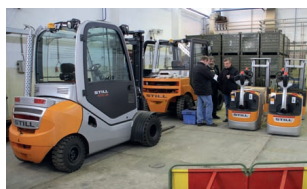
48 Základna humanitární pomoci Zbiroh