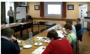
32 Řízení lidských zdrojů – MěÚ Žďár nad Sázavou