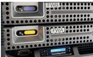
40 Technologická centra krajů