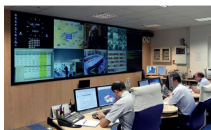
28 Informační systém integrovaného záchranného systému