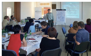
50 Dílna kvality Kopřivnice