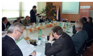
22 Rozvoj projektového řízení a strategického plánování na Krajském úřadu Zlínského kraje