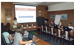
14 Vzdělávání v eGON Centrech