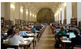
34 Národní digitální knihovna