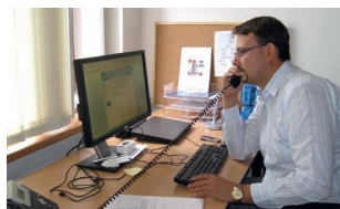
46 Zkvalitnění výkonu činnosti zastupitelů a posílení kapacity místní samosprávy v ČR – Vzdělaný zastupitel