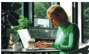
16 Datové schránky