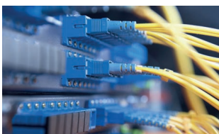
38 Technologická centra obcí s rozšířenou působností