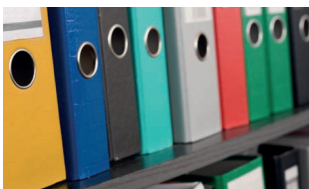
36 Procesní modelování agend veřejné správy