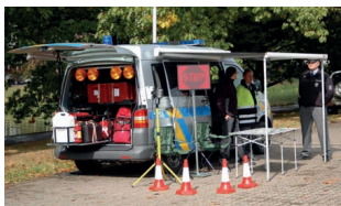
20 Mobilní kontaktní a koordinační centra