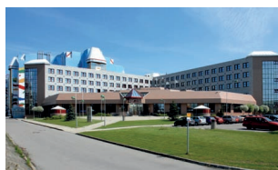
24 Národní digitální archiv