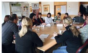
42 Strategické řízení v obcích – kvalitně a efektivně