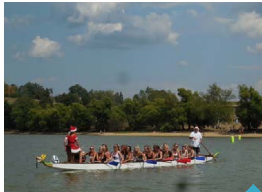
Závody dračích lodí na Pilské nádrži již neodmyslitelně patří ke Žďáru

Závodů se účastnilo 32 posádek nejen ze Žďáru a okolí, ale i z větší dálky jako Jizerský drak z Jablonce nad Nisou, Horalki z Červeného Kostelce. Pádlovalo se na velkých dvacetimístných dračích lodích a na deseti-