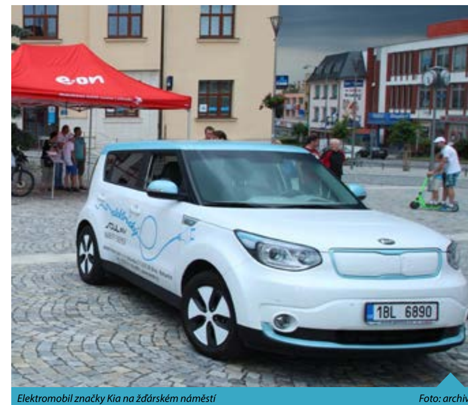
Elektromobil značky Kia na žďárském náměstí

... v roce 2017 MHD Žďár přepravila 1 032 128 osob a najela 337 755 km? To je stejná vzdálenost jako ze Země na Měsíc.