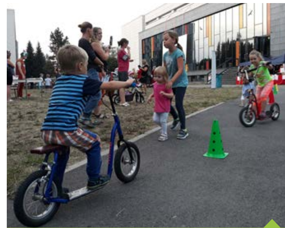
Děti si užívají doprovodný program během letního kina

Ujít si nenechte ani Filmové kluby, které se konají každý třetí čtvrtek v měsíci. 20. září Miloš Zabloudil představí film Utøya, který rekonstruuje masakr, který se stal na norském ostrově během setkání mladých sociálních demokratů.