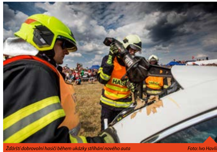
Žďárští dobrovolní hasiči během ukázky stříhání nového auta