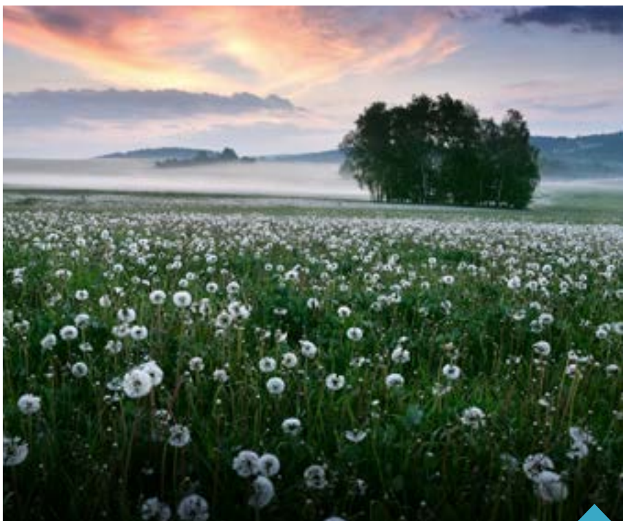
Jedna z vystavovaných fotografií