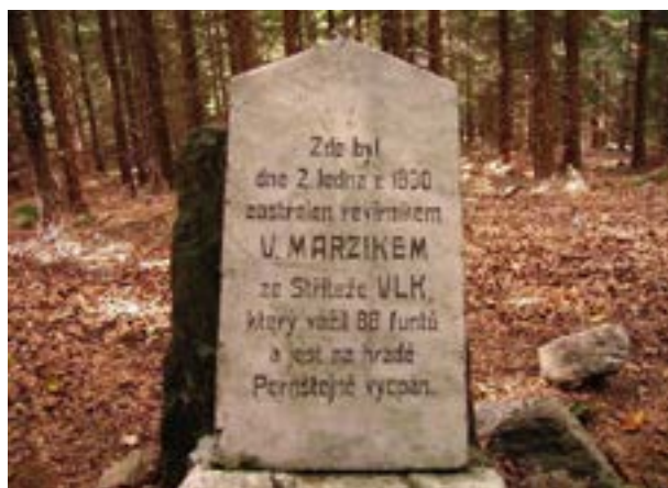
Pomník vlka u Jinošova

Uvedený vlk-samec bývá všeobecně považován za posledního svého druhu na Vysočině, nicméně věc je poněkud složitější, neboť ve čtvrtek 28. března 1861 byl nedaleko Jinošova zastřelen další vlk-samec, jehož preparát se nachází v depozitáři zámku Náměšť nad Oslavou. V tomto případě vlka skolil revírník hraběte Haugwitze Anton Schwejda (Antonín Švejda). Tento exemplář měří od čenichu po kořen ocasu 129,5 centimetrů, ocas má dlouhý 46 centimetrů, vážil prý 39,78 kilogramů a jedná se o skutečně posledního vlka uloveného na Vysočině.