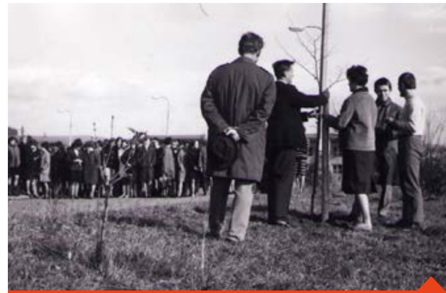
Dochované záběry ze sázení lípy svobody