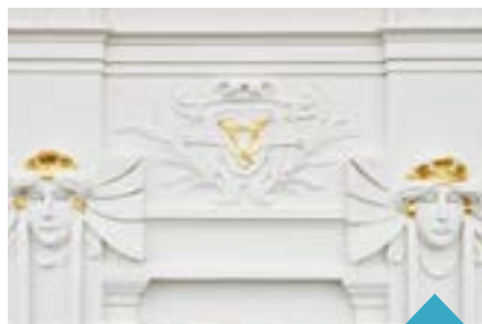
Nová fasáda

Během odpoledne se můžete setkat s malířkou a sochařkou Klárou Klose na vernisáži její výstavy v prostorách přístupných