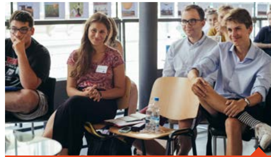
mladí kandidáti do obecních zastupitelstev během semináře