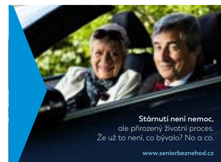
Stárnutí není nemoc, ale přirozený životní proces. Že už to není, co bývalo? No a co. www.seniorbeznehod.cz