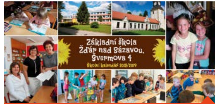
Ukázka kalendáře, který vydává 4. základní škola