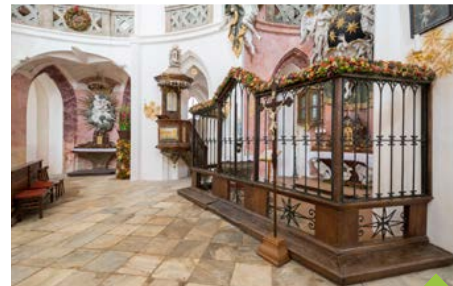
Zelená hora rozkvetla barvami a vůněmi