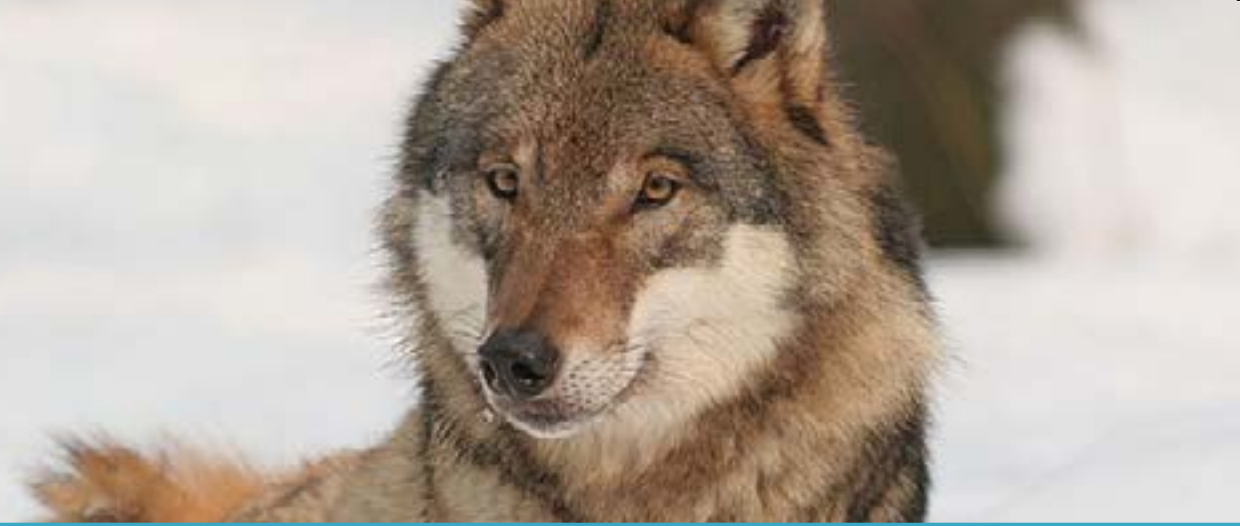
Vlk obecný - Canis lupus