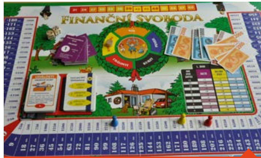
Hra Finanční svoboda slouží k výuce finanční gramotnosti