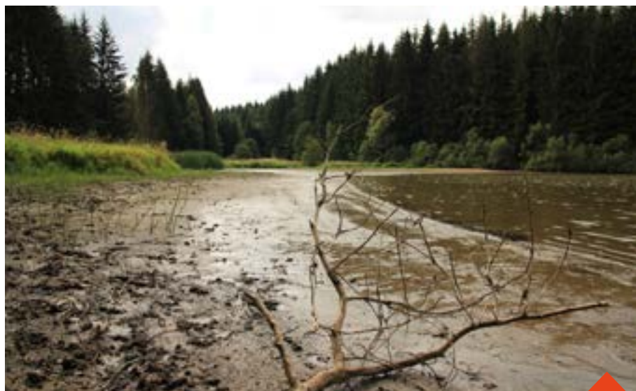
Vyschlé břehy u nádrže Staviště.