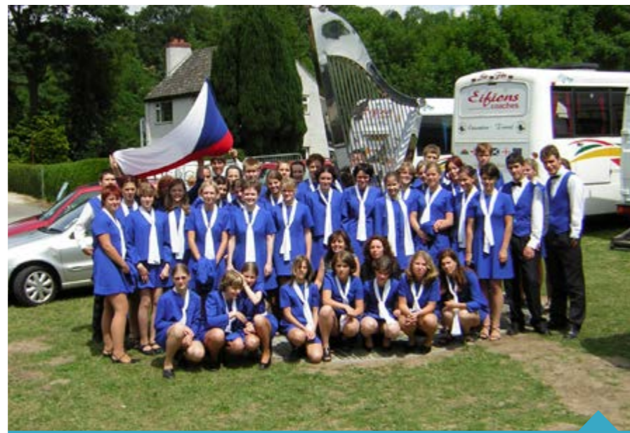
Před mezinárodní soutěží ve Llangollen - Wales 2015

Koncert bude rozdělen na poloviny, přičemž první z nich začne v 17:00. Zhruba hodinový program bude vyhrzený pro sbory Cvrčků a přípravku Žďaráčku. Od 18:30 pak bude jeviště patřit koncertnímu sboru. V úvodu vystoupí současní