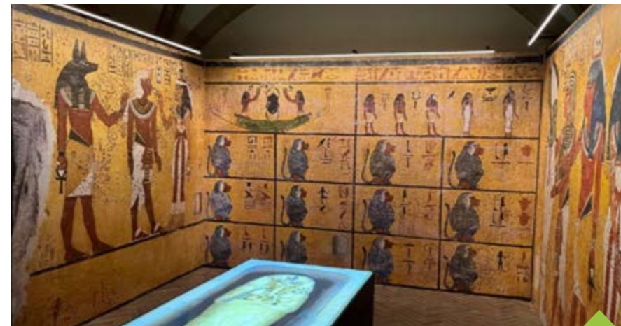
Výstavu zahájí 18. května vernisáž s komentovanou prohlídkou