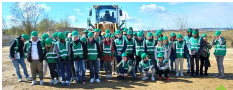
Gymnazisté navštívili v rámci Erasmus+ rakouský Pinkafeld

O zemětřesení jsme se s místními bavili mnohokrát a celkem jsme se uklidnili. Jaké velké bezpečnostní kontroly v Istanbulu probíhají, jsme se dozvěděli až z reportáže ČT, kterou natáčeli právě v době, kdy jsme se tam pohybovali i my. To už jsme ale naštěstí byli doma.