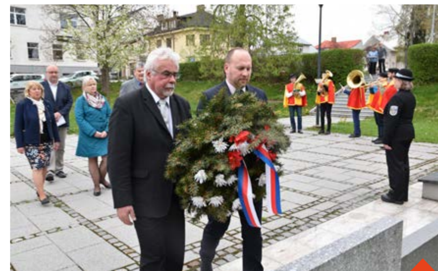
Spolu s vedením města a dalšími hosty uctí památku padlých místní školy

Zváni jsou také zastupitelé města, nejstarší děti ze základních škol i široká veřejnost. Před rokem jsme zde psali, že válka není jen historickou událostí, ale kousek od nás hrůznou realitou pro mnoho lidí. Po víc než roce od vypuknutí války na Ukrajině můžeme jen smutně konstatovat, že se bohužel nic nezměnilo. (red)