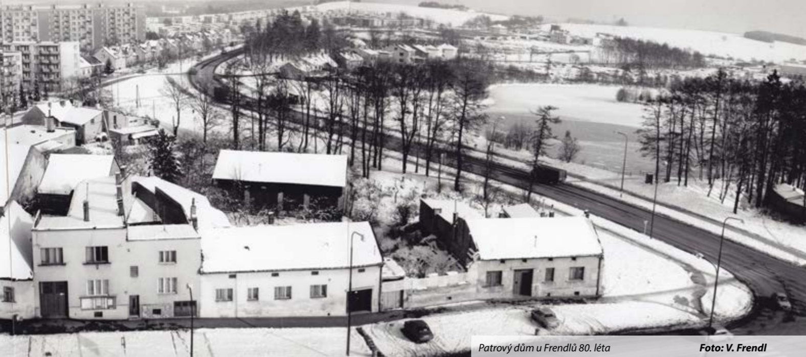
Patrový dům u Frenclů 80. léta