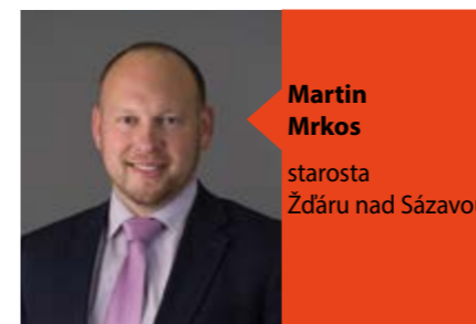
Martin Mrkos starosta Žďáru nad Sázavou