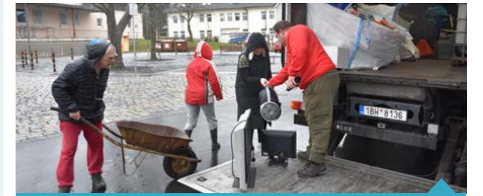
Sběr nebezpečných odpadů probíhá každoročně v režii města a AVE