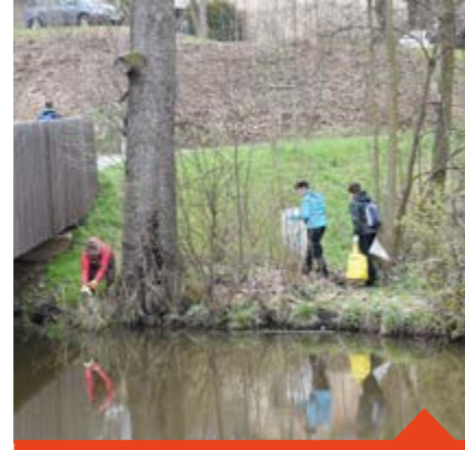
Úklid v režii města

Do akce se zapojují děti ze školek, studenti základních a středních škol, spolky, hasiči, obce, firmy. Některé firmy využily akce pro teambuilding, školy zase díky Čisté Vysočině uvolní třídy pro přijímací zkoušky a maturity.