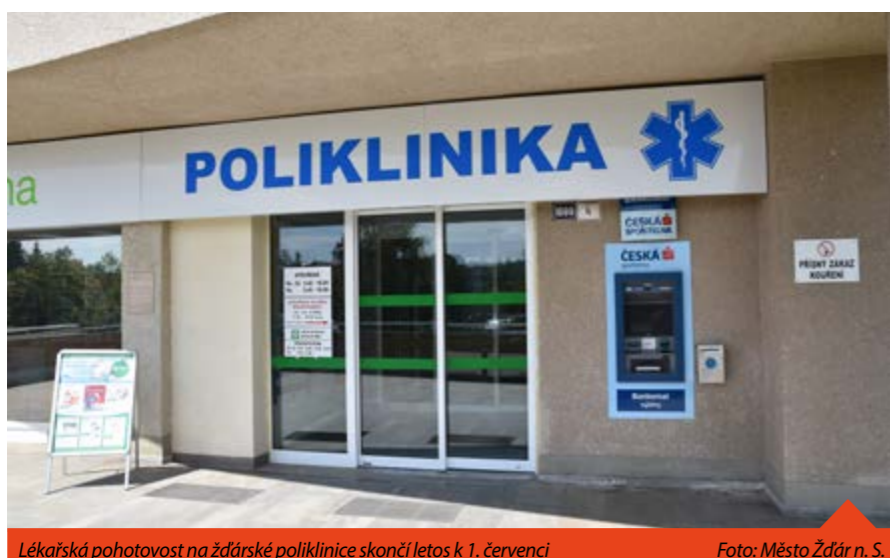
Lékařská pohotovost na žďárské poliklinice skončí letos k 1. červenci