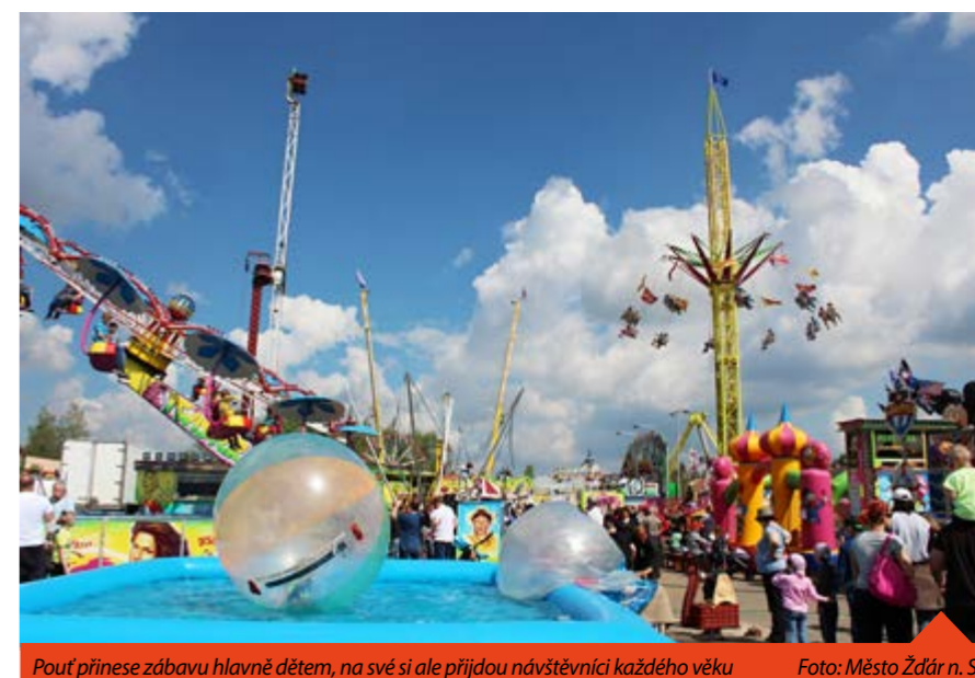
Pout' přinese zábavu hlavně dětem, na své si ale přijdou návštěvníci každého věku