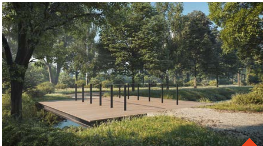
Lávka Táferna upoutá velkorysou plochou s odpočinkovými terasami. Vizualizace: Refuel

Lávka na Dvorské ulici vyjde na 1,7 milionu korun s DPH. U obou lávek pod Bránským rybníkem počítá město s náklady zhruba 6,5 milionu korun s DPH. „S náklady by mohla pomoci dotace. Už přiznaná dotace z Fondu Vysočiny pokryje 1,3 milionu korun, na druhou lávku bude Žďár žádat o dotaci v programu Interreg. V případě úspěchu pokryje až 80 % nákladů, to je asi 2,7 milionu korun,“ doplňuje dotační specialista Roman Přecechtěl. (red)