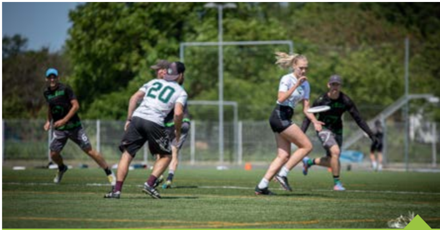
Žďáračky vyrazí v srpnu na ME v Padově. Držte jim palce!

Velké očekávání máme také od české juniorské reprezentace, za kterou bude v srpnu bojovat rovnou pět žďárských