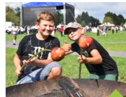
Alotria na humnech

Nedělní odpoledne 3. září bude opět patřit dětským hrám. Že i téma cisterciácké kra-