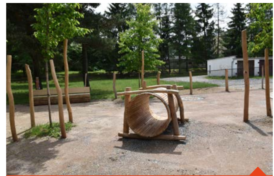
Nové hřiště nabídne třeba pítko nebo psí pisoár - originální český prvek pro psí kluky

Hřiště nabízí dřevěné prvky pro psí agilitu, tyto prvky představují dráhy, které mohou psi překonávat, střídat i navzájem kombinovat. Novinkou je i psí pisoár. Prosíme, respektujte provozní řád, a především, chovejme se k těmto novým věcem s péčí. Hřiště je doplněné o dřevěné kostky, které je možné volně posouvat a přizpůsobovat si tak plochu podle potřeb.