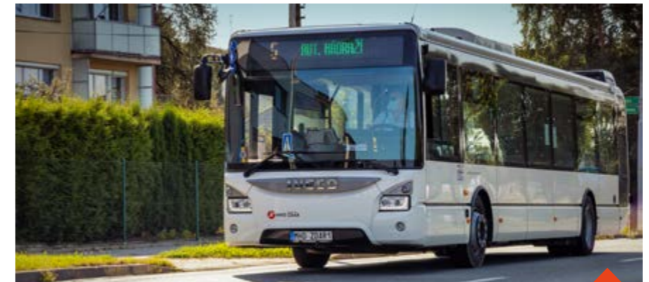
Platby bankovní kartou jsou na vzestupu, lidé je využívají častěji.

karet zučtovávají transakce. Platby za jízdné jsou totiž tzv. slučovány v určitém časovém období, u některých karet je to 24 hodin, u jiných i 3 nebo 5 dnů. Pokud jedete autobusem víckrát, mohou se všechny transakce odečíst z vašeho účtu pouze jednou položkou. Problém nastává i v případě, že vlastník karty nemá dostatek peněz na účtu - banka pak transakci zkouší opakovaně, i po 28 dnech. Poslední záležitostí je provedení tzv. předautorizace, podle typu karty dochází k zablokování určité částky. Tato blokáce se pak stornuje a nahradí sražením skutečné ceny jízdného.