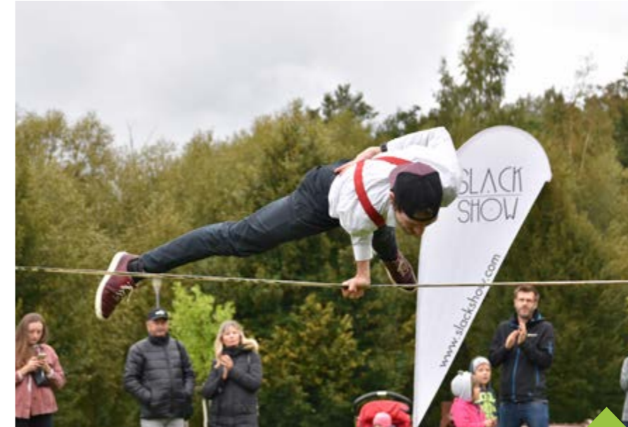
Futrování loni oživila exhibice na slackline i následný workshop