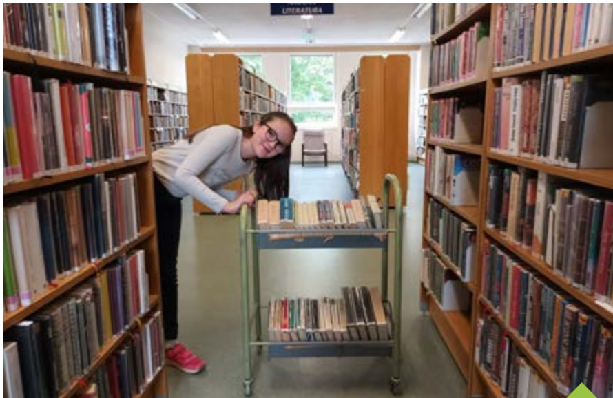
Kulturní laboratoř pozve děti do zákulisí nejrůznějších kulturních institucí