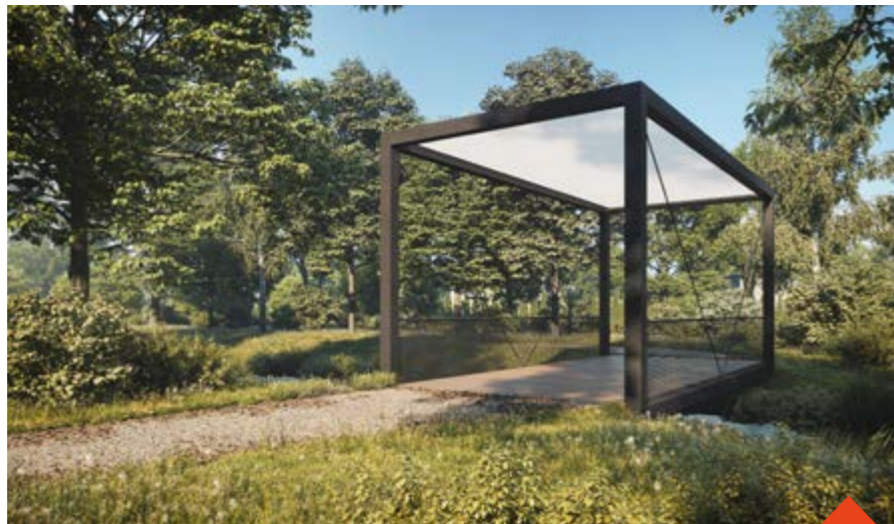
Bránská lávka ve tvaru hranolu bude osm metrů dlouhá a čtyři metry široká. Vizualizace: Refuel

ků a zhoršující se technický stav stávajících dvou lávek pod Bránským rybníkem, jsou hlavní důvody pro jejich opravu. Lávky jsou na evropské cyklistické trase EuroVelo 4 a