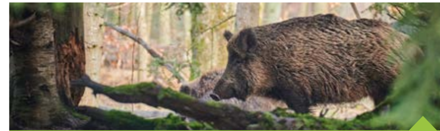
Vernisáž výstavy proběhne 13. září od 16.00 v Regionálním muzeu na Tvrzi

Širokou veřejnost přístupnou formou seznámí s cestou černé zvěře lidskými dějinami a kulturou, s její biologií, způsobem života, přirozeným chováním, historickými a moderními způsoby lovu. Výstava představí také mysliveckou mluvu, nejdůležitější plemena loveckých psů využívaných při lovu černé zvěře, ale i ško-