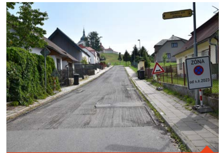
Ulice Vejmluvova a část Sychrově se do konce prázdnin dočkají nového povrchu