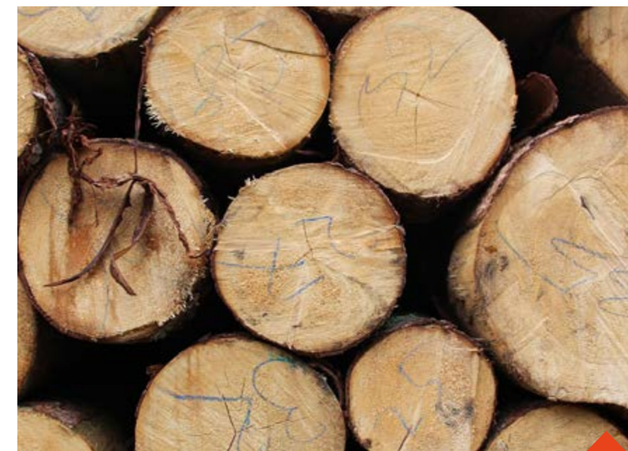
Dřevo z městských lesů je možné koupit od loňska, pro Žďáráky se slevou

Pojem „samovýroba dřeva“ zjednodušeně znamená, že si lidé na předem domluveném místě sami nasbírají nebo vyzvednou dřevo. Cena za samovýrobu dřeva se bude odvíjet podle toho, o jaký druh dřeva budete mít zájem, máte tři možnosti. Úklid větví a dalších drobných zbytků po těžbě je zcela zdarma, zaplatíte tím, že místo svým sběrem pomůžete vyčistit od kletu. Zpracování zbylé kulatiny po těžbě, případně padlé souše se počítají za 150 Kč/PLM (plnometr) včetně DPH. Přes společnost SATT si také můžete zajistit i samotný odkup kulatiny vhodnou pro výrobu palivového dříví připravenou na odvozní místo v lese. U této možnosti dostanou Žďáráci slevu 10 %. Zároveň je odkup palivového dřeva limitován maximálním množstvím dřeva na osobu 10 m 3 na kalendářní rok. Základní cena bez slevy je 800 Kč/PLM včetně DPH. Ceny se mohou měnit podle aktuální situace na trhu.