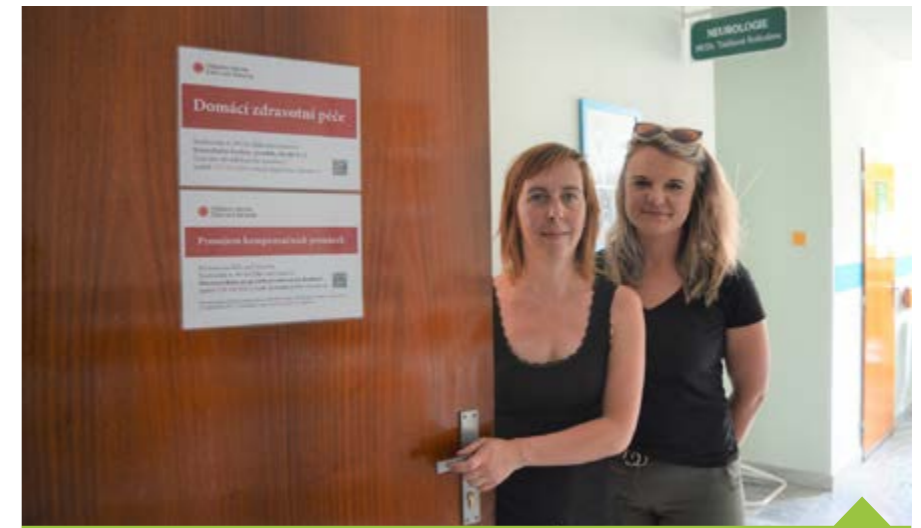
Obě služby přesídlily do společné kanceláře ve 3. patře polikliniky

Všeobecné zdravotní sestry Domácí zdravotní péče Oblastní charity Žďar nad Sázavou poskytují odbornou zdravotní péči lidem, kteří z důvodu stáří, nemoci či zdravotního postižení nejsou soběstační. Pečují o pacienty v domácím prostředí na základě doporučení ošetřujícího lékaře ve spolupráci s rodinnými příslušníky, aby jim