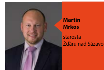
Martin Mrkos starosta Žďáru nad Sázavou