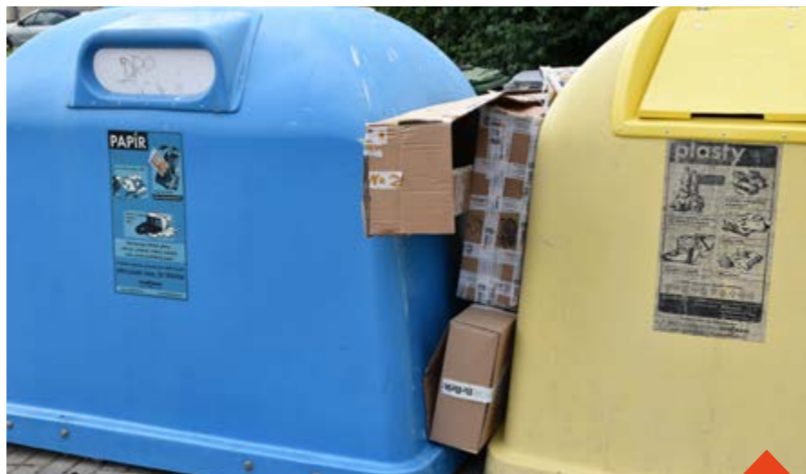
Takovéto odložení odpadů je černá skládka, pokuta může být až 50 tisíc korun

Odpad přitom stačí vhodit přímo do popelnice, případně ho předtím sešlápat nebo rozřezat. Po sešlápnutí PET lahve nebo krabice se jich do kontejneru vejde