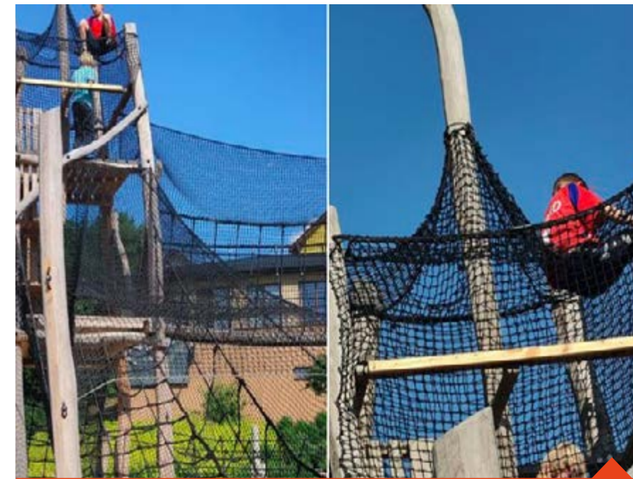
Za pouhý rok existence hřiště se škody na něm nasčítaly na zhruba 50 tisíc korun

Na týdenním pořádku jsou zde trhliny v sítích, poškozené zábradlí, aktuálně je natřena zástěna pískoviště. Souhrn škod se už vyšplhal na zhruba 50 tisíc korun. Přetržení lana vyžaduje velkou sílu nebo ostrý předmět, na protřetí sítě naopak někdy stačí, když na herní prvek určený pro pěti až čtrnáctileté děti vyleze dospělý (zvláště s vyšší hmotností) a špatně šlápne. Pro malé děti, které se na hřišti nedokáží samostatně pohybovat, nemá být řešením rodič, který leze s dítětem, ale pískoviště nebo nižší prvky. Naopak pro starší slouží workout. A záměrné ničení hřiště si komentář ani nezaslouží.