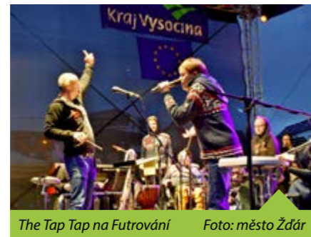
The Tap Tap na Futrování

Jídlo z celého světa doplní 16. září i kuchařské umění cisterciáckého dědictví. Díky spolupráci s městy Zwettl a Vyšší Brod poznáme cisterciáky všemi smysly. K tomu si vychutnáme hudbu v podání Michaely Šedivé, Černého Ledňáčka, Michala Horáka a Mayday.