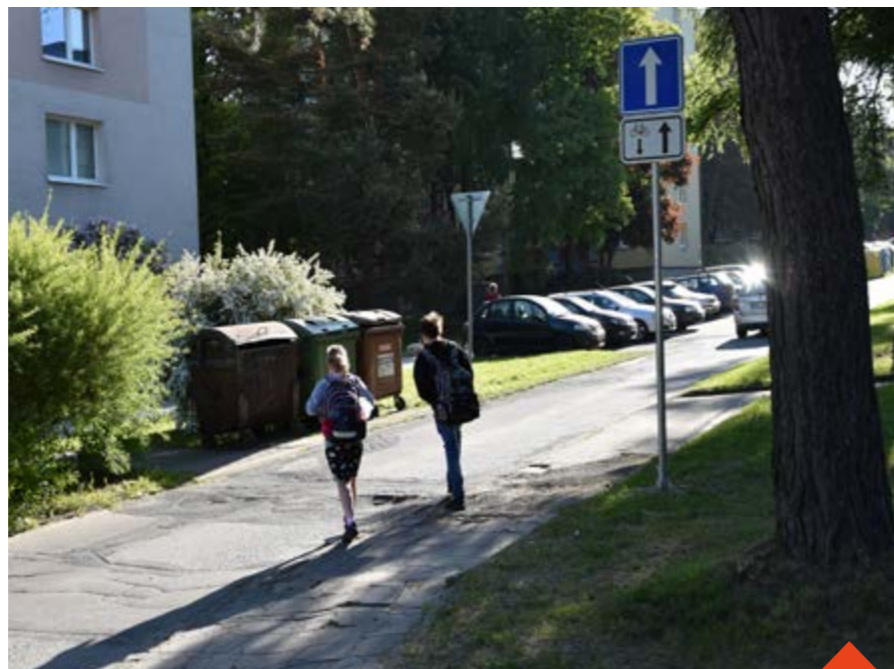
S opatřením souhlasí i škola, navzdory menším komplikacím pro zaměstnance

Z pozorování vyplývá, že auta se školáky využívají k zastavení nové K+R ve Vančurově ulici, Švermovu ulici nebo zastavují v Nerudově ulici. Desítky dětí přijíždějící příměstskými autobusy chodí ke škole pěšky od zastávky, další děti chodí pěšky přímo z domu nebo po vysazení poblíž školy. Zástupci městské policie, školy, odboru dopravy i vedení města se po vyhodnocení