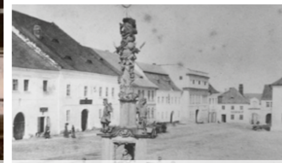
Vpravo poslední dům s atikou, doba kolem r. 1880