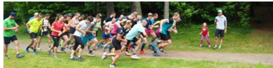
Běžecký seriál Žďárák se těší velkému zájmu místních běžců i těch z okolí

Podzim přinese opět čtyři krosové závody, tradičně vždy první středu v měsíci,