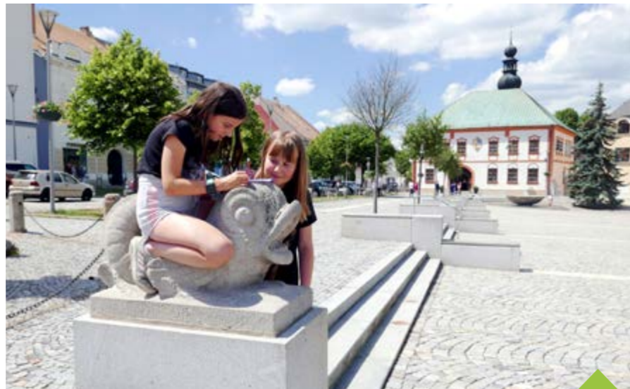
Putování se žďárským kaprem zavede návštěvníky i na náměstí Republiky

Putování městy Koruny Vysočiny se účastní Žďár nad Sázavou, Nové Město na Moravě, Bystřice nad Pernštejnem, Jimramov a Ned-