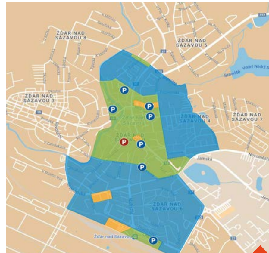
Návrh parkování v širším centru města rozlišuje modrou, zelenou a oranžovou zónu