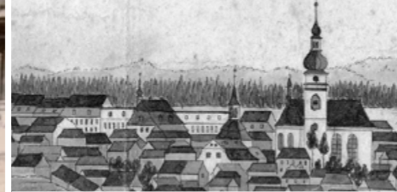
Pohled na domy s atikou, kolem roku 1840