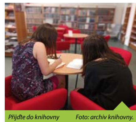
Přijďte do knihovny

V neposlední řadě si nenechte ujít pravidelnou dávku inspirace ze světa knih. Knihovna totiž od října otevírá Čtenář-