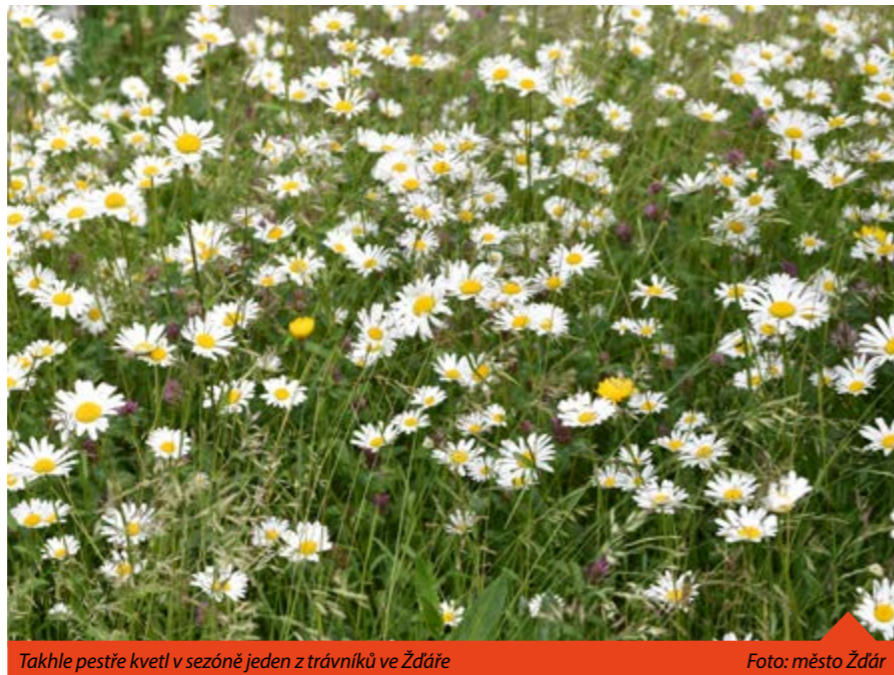
Takhle pestře kvetl v sezóně jeden z trávníků ve Žďáře

Delší tráva a přirozenější vegetace je do movem pro mnoho druhů rostlin, hmyzu a drobných živočichů. Omezením četnosti sečení umožňujeme těmto tvorům najít úkryt, potravu a prostor pro rozmnožování. Tak se i město stává útočištěm pro různorodou paletu života, která přispívá k ekologické rovnováze. Taková tráva má větší schopnost zadržovat vlhkost a snižovat odpařování. To je důležité zejména v aktuál-