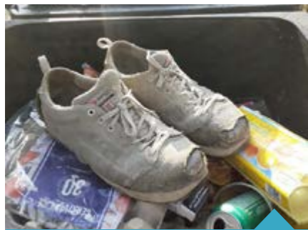
Obsah jedné z popelnic