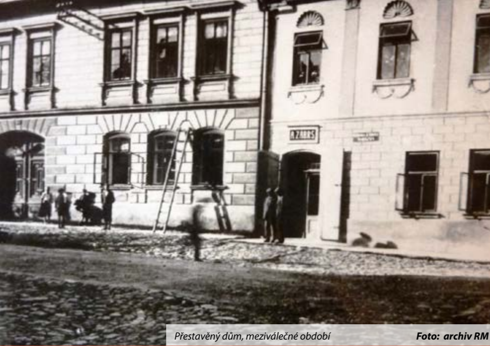
Přestavěný dům, meziválečné období