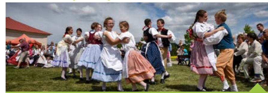
Obnovená poutní setkání se konají vždy na svatého Václava, 28. září

Po celá tři století, která uplynula od vysvěcení poutního kostela sv. Jana Nepomuckého na Zelené hoře, přicházela k jeho pěti branám procesí poutníků z obou stran historické zemské hranice. Na tuto mimořádnou tradici navázala správa farnosti Žďár nad Sázavou II ve spolupráci se spolkem Putování za Santinim vytvořením projektu Lidových