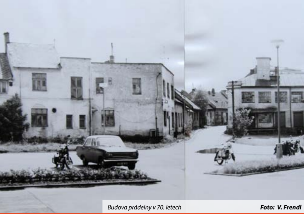
Budova prádelny v 70. letech