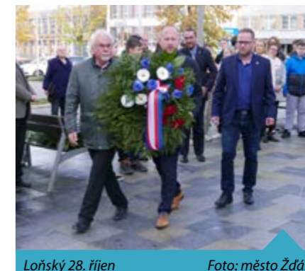
Loňský 28. říjen