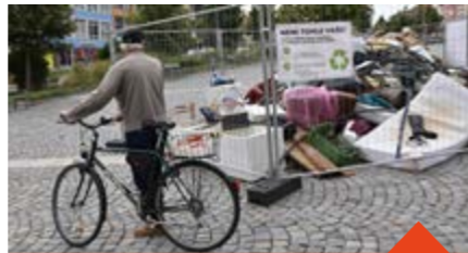
Kampaň budila velký zájem.

Tuna kartonů a tuna objemného odpadu, to je množství odpadu, které svozové auto nasbíralo odložený u popelnic za průměrný měsíc. Město vydává na tento úklid, který se dělá dvakrát týdně, kolem 400 tisíc korun, sbírá se mimo obvyklý svoz.