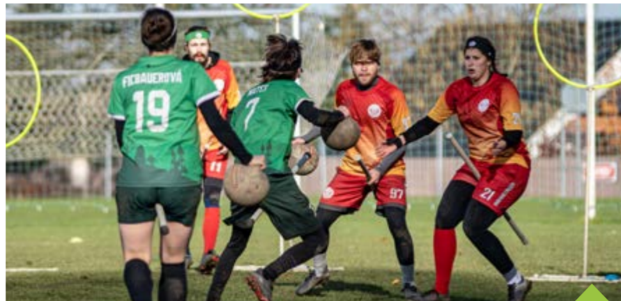
Famfrpál kombinuje hned několik sportů najednou, hraje se s více různými míči

Netradiční sport kombinující ragby, vybíjenou a házenou je fyzicky náročný a dynamický. Famfrpál se hraje se čtyřmi míči - jedním camrálem, kterým se skóruje skrz obruče, a třemi potlouky, které slouží k vybíjení protihráčů. Do Žďáru nad Sázavou přivedl sportovní svátek jeden z jeho obyvatel a zároveň hráč brněnského týmu. Samotnou hru si budou moci zájemci vyzkoušet v neděli o polední přestávce pod vedením hráčů famfrpálu. Na nadcházející mistrovská utkání se fanoušci mohou naladit už víkend předem. Na sobotu 14. října láká Kino Vysočina na maraton všech osmi filmů o Harrym Potterovi. Město Žďár nad