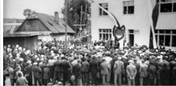
Odhacení pamětní desky v roce 1935