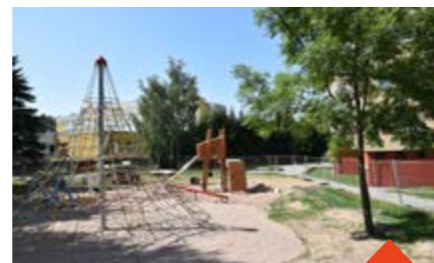
Hřiště na Palachově

Hřiště je v době uzávěrky zpravodaje téměř hotové, veřejnosti se otevře, jakmile bude město mít potřebné certifikáty. Herní prvky i celé hřiště musí mít podle českých norem certifikaci, která říká, že jsou prvky i herní prostor bezpečné a splňují veškeré legislativní požadavky. Jakmile je tedy hřiště