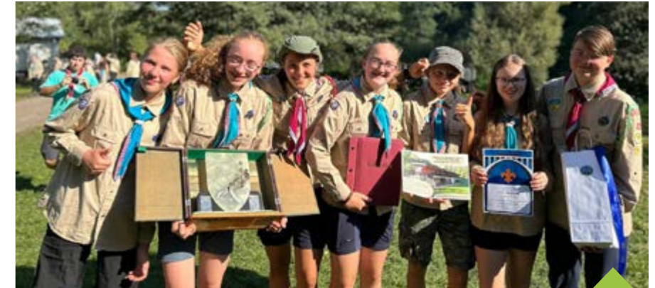
Žďárské skautky se zaslouženým oceněním ze Svojsíkovy závodu

Soutěžilo se v mnoha různých dovednostech. A to nejen „tradičně skautských“, jako