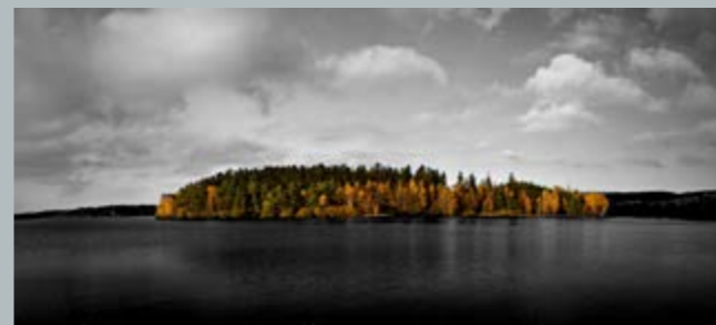
2. místo - Ostrov barev