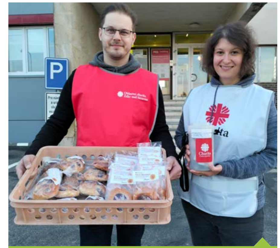
Koláč pro hospic si mohou zájemci koupit ve středu 4. října v ulicích Žďaru

„K tomu, abychom dokázali efektivně pomáhat, potřebujeme rozšířit personál a postupně tým dovybavit lékařským vybavením a dalšími potřebnými pomůckami a materiálem,“ vysvětluje vedoucí Domácího hospice Monika Milichovská. Domá-