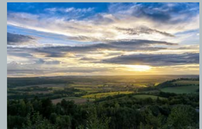
3. místo - Vyhlička Štikov