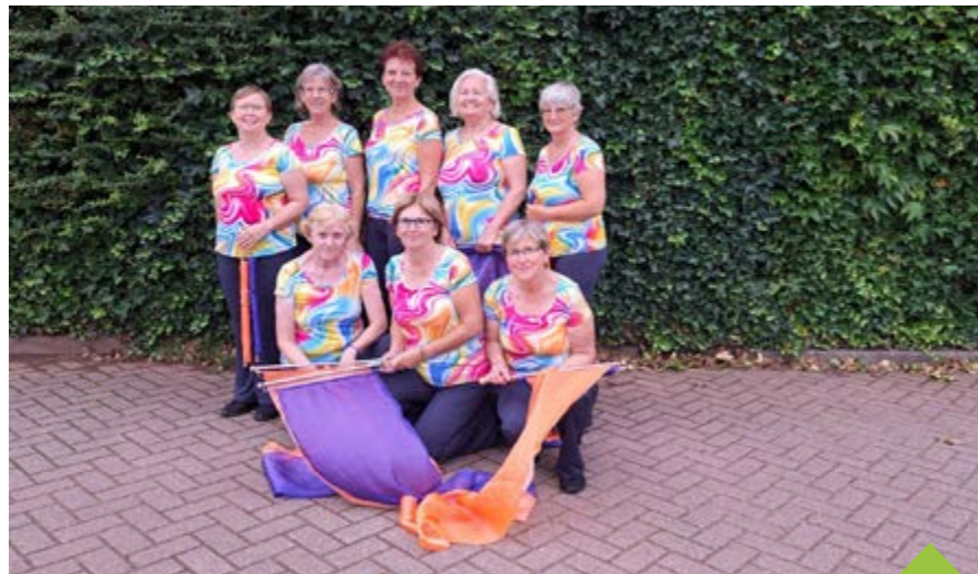
Členky oddílu Sport pro všechny na Gymnaestrádě