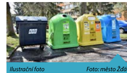
Ilustrační foto

V roce 2022 se ve díky recyklaci a využití papíru, skla, plastů, kovů, nápojových kartonů a dalších druhů odpadu v rámci tříděného sběru a využití odpadů v systému EKO-KOM uspořilo 24,5 GJ energie. To je množství, které za rok spotřebuje víc než 376 tisíc domácností. V případě tolik diskutovaného globálního oteplování přispěl systém EKO-KOM ke snížení emisí o víc než 900 tisíc tun ekvivalentu CO 2 . V roce 2021 získalo město z neziskového systému