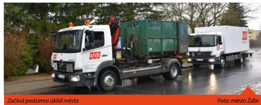
Začíná podzimní úklid města