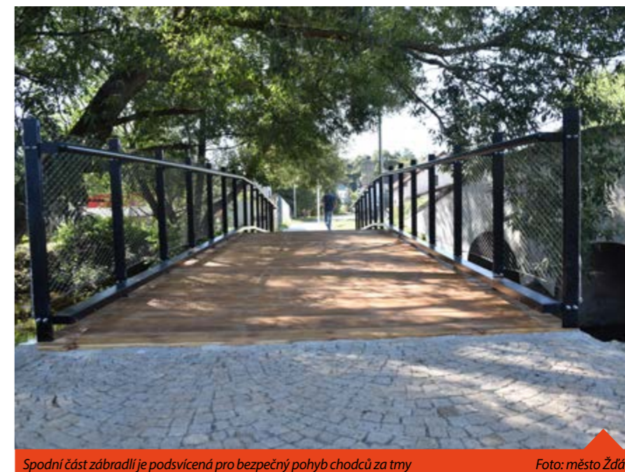
Spodní část zábradlí je podsvícená pro bezpečný pohyb chodců za tmy