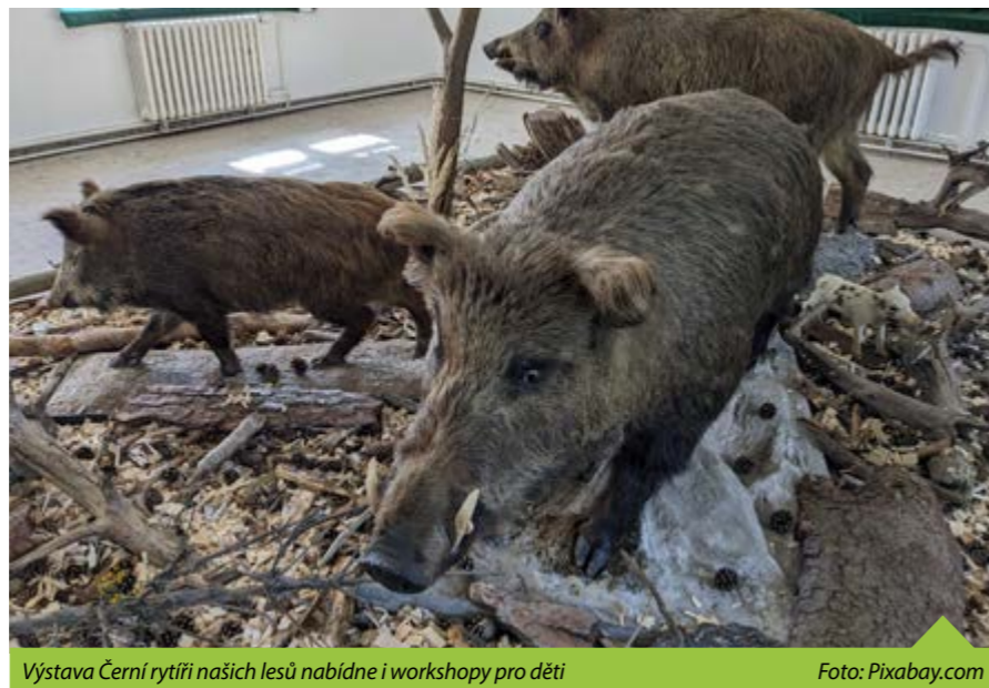
Výstava Černí rytíři našich lesů nabídne i workshopy pro děti

K výstavě je připravený také doprovodný edukační program pro školky a školy. Veřejnost se může těšit na tvořivá dopoledne pro děti. Tvořivé dopoledne se Štětkou proběhne v sobotu 28. října a v pátek 17. listopadu 2023 od 9 do 11 hodin. Děti se mohou těšit na autorské čtení a povídky o přírodě se Zdeňkou Šiborovou, autorkou knihy Prasátko Štětinka a malá Majdalenka. Ve výtvarné dílně si s lektorkami z Regionálního muzea užijí tematické tvoření