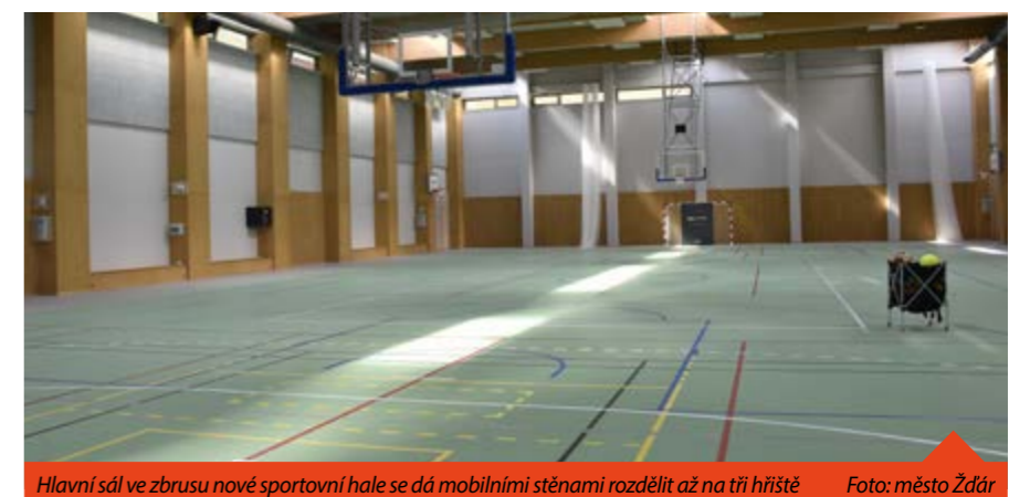
Hlavní sál ve zbrusu nové sportovní hale se dá mobilními stěnami rozdělit až na tři hřiště

Sportovní hala o půdorysu 55 na 47 metrů je vysoká něco málo přes 11 metrů. Hlavní objekt je přizpůsoben pro provozování florbalu, basketbalu, volejbalu, házené a tenisu.