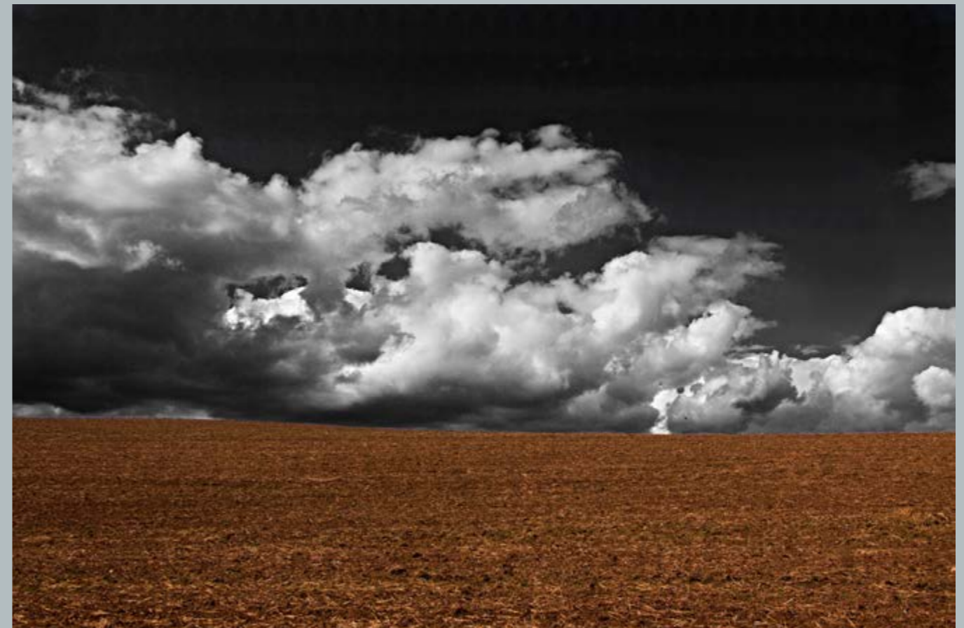
1. místo - Mračna