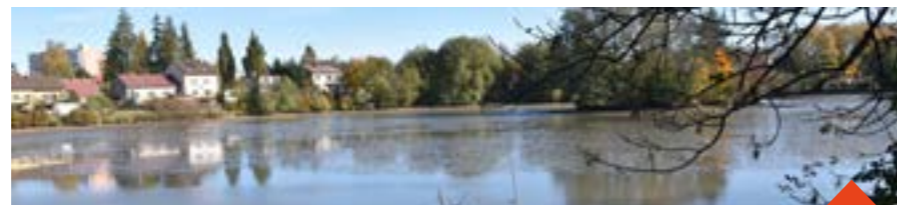
Velký žďárský rybník neboli Hornák už neslouží chovu ryb, loni se lovil naposledy.

Žďársko je tradiční rybníkářskou oblastí, jenom město Žďár má rybníků celkem třináct, zabírají plochu cca 27 hektarů. O některé se nově město stará samo ve spolupráci s Moravským rybářským svazem, jiné pronajímá pro chov ryb.