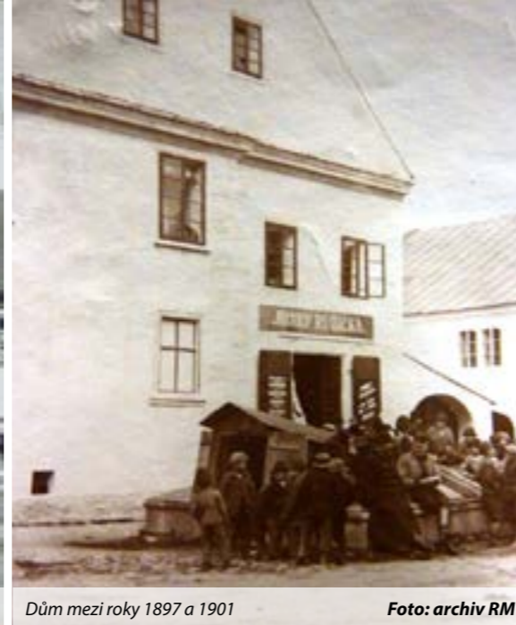
Dům mezi roky 1897 a 1901