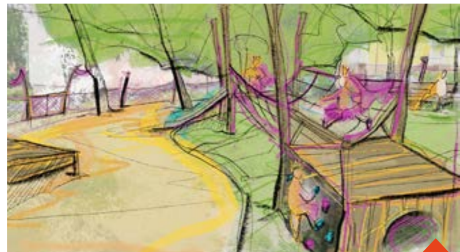
Hřiště na Okružní dolní poslouží hlavně nejmenším dětem

V horní části hřiště bude houpačka pro menší děti se sedákem s oporou zad. Dopadové plochy houpačky a skluzavek budou