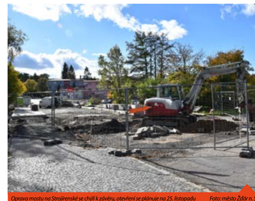
Oprava mostu na Strojírenské se chýlí k závěru, otevření se plánuje na 25. listopadu