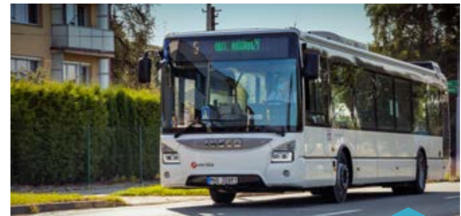
Linka MHD č. 7, na spoji 9 se od listopadu dočká změn