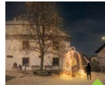
Nová výzdoba před muzeem

Abyste bylo o důvod víc se o adventu zastavit a potkat se s přáteli v prima atmosféře, je pro centrum města, a především pro Nádražní ulici připraven kulturní program. Kromě drobnějších koncertů a kostýmových čtení to letos bude třeba i zimní kino nebo koncert Voxela. Přehled adventního programu najdete ve zpravodaji na straně