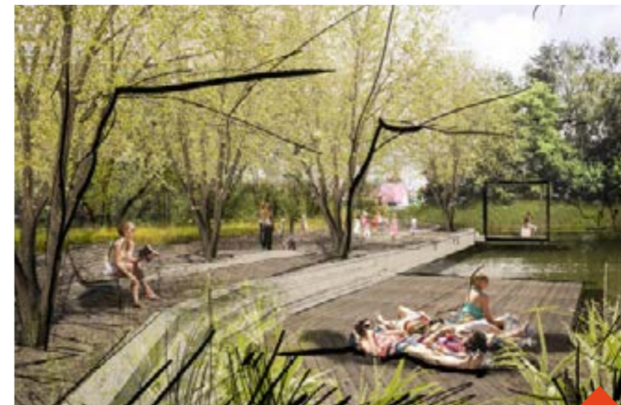
Rybník by se mohl dočkat odbahnění i úpravy okolí v roce 2025.

Autorka a zástupci města představili nedávno záměr na setkání s veřejností, otázky směřovaly především na rovnováhu