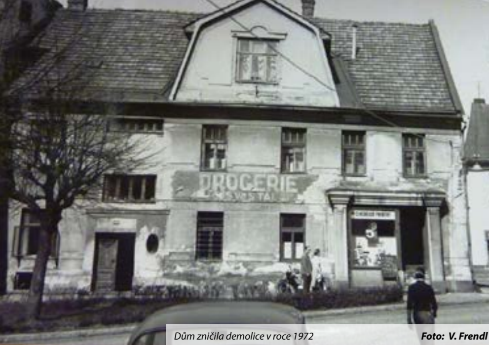
Dům zničila demolice v roce 1972