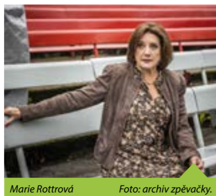
Marie Rottrová