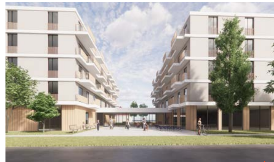
Na Okružní horní mají vyrůst dva domy propojené společným podnožím Vizualizace: BDSO

Výstavbu dalšího objektu plánuje BDSO v místě bývalých jeslí na horní Okružní. Tam vyrostou domy hned dva s celkem stovkou bytů pro bydlení seniorů (nad 50 let věku) a navíc se sociálními i zdravotními službami. První bude kompletně bezbariérový dům se zázemím speciálně uzpůsobeným potřebám