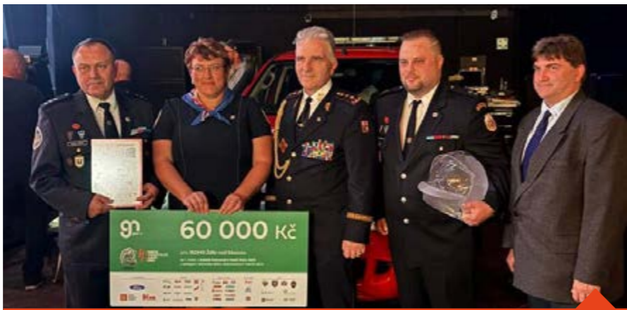
Zástupci jednotky a města s šekem a cenami ze soutěže Dobrovolní hasiči roku 2023

Městští hasiči dostali po schválení odbornou porotou ve veřejném hlasování nejvíce hlasů v celé soutěži jednotek, přes-