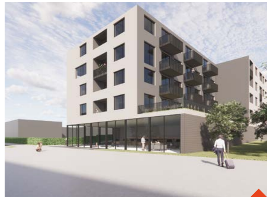
Pětipatrový dům s nebytovými prostory v přízemí nahradí bývalý Batyskafr Vizualizace: BDSO

V první čtvrtině roku plánuje firma setkání s občany s prezentací záměru. Závažnou rezervaci pak BDSO spustí cca od poloviny roku 2024. Už teď je možné se registrovat na e-mailu info@bdso.cz, jakmile bude rezervace bytů spuštěna, zájemci dostanou avízo.