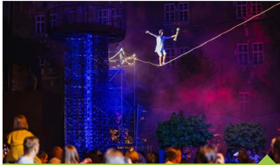
Provazochodec i akrobatka předvedou své umění nad hlavami diváků

Vrcholem programu bude vystoupení moderního provazochodce, který předvede své umění na lajně napnuté z jeřábu ke Staré radnici. Slacklinera pak vystřídá akrobacie na šálách, zavěšených z lajny nad hlavami diváků. Vystoupení doprovodí