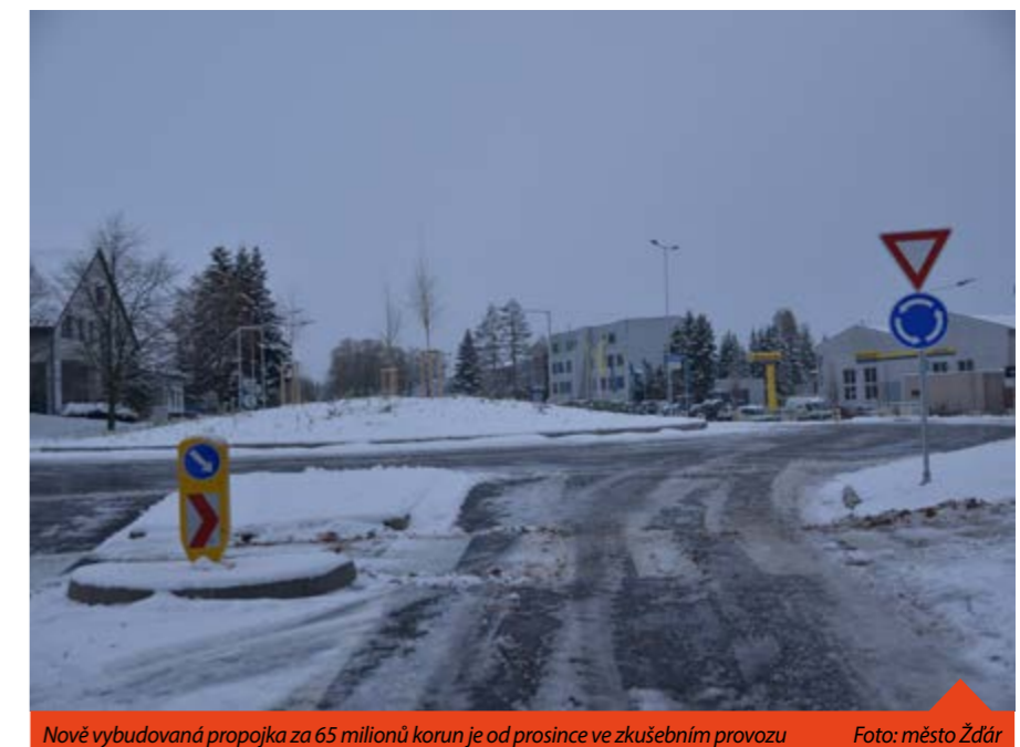
Nově vybudovaná propojka za 65 milionů korun je od prosince ve zkušebním provozu