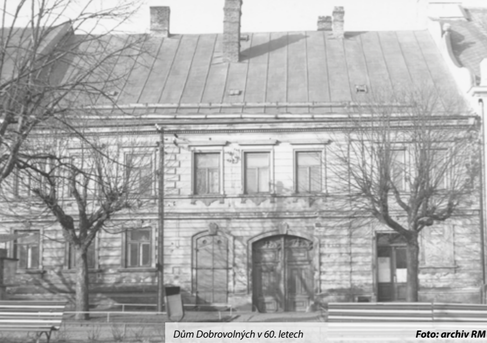
Dům Dobrovolných v 60. letech