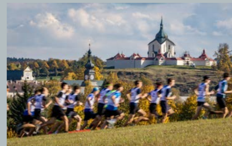
3. místo - Republikové finále v přespolním běhu 2023