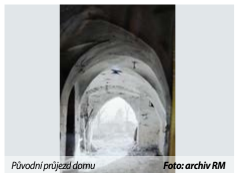
Původní průjezd domu

Žďárský zpravodaj, měsíčník občanů města Žďáru nad Sázavou • 10. ročník • Vydává město Žďár nad Sázavou, www.zdarns.cz. Redakční rada: Blanka Sobolová, Tamara Pecková Homolová, Helena Zelená Křížová. Šéfredaktor: Blanka Sobolová, tel. 733 465 035, e-mail: blanka.sobolova@zdarns.cz • Sídlo redakce: Žitkova 227/1, 591 31 Žďár nad Sázavou • Do všech domácností zdarma • Počet výtisků: 10 500 kusů • Datum vydání: 4. prosinec 2023 • Distribuce: Renvy Trade, s. r. o., Grusova 413, Pardubice • Tiskne: Tisk Centrum s.r.o., Modřická 645/62, Moravany u Brna • Registrace: MK ČR E 21706. • Korektury: Lenka Mašová • Sazba: Lukáš Zvolský • Inzertní příloha: Blanka Sobolová, 733 465 035 • Fotografie na titulní straně: město Žďár nad Sázavou