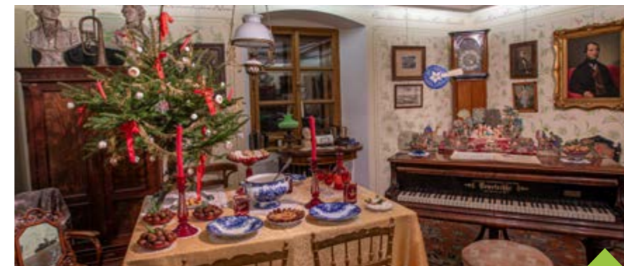
Vánoce v muzeu na Tvrzi odhalí Příběh vánoční ozdoby