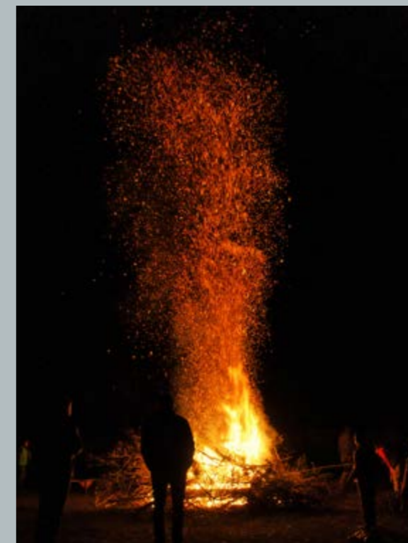
2. místo - Pálení čarodějnic