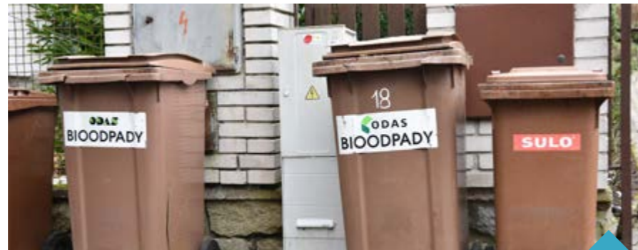
Svoz bioodpadů se od ledna do března mění, jiné jsou i svozy o Vánocích

Svozy v zimě (leden - březen 2024) za příznivého počasí: