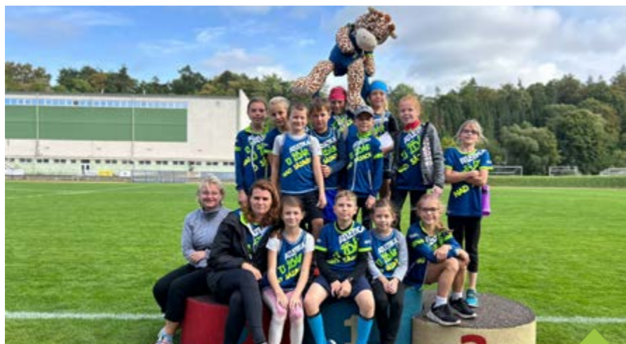
Mladé naděje i jejich trenéři se radují se zisku četných medailí