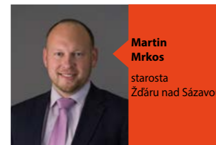
Martin Mrkos starosta Žďáru nad Sázavou