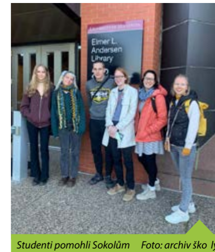
Studenti pomohli Sokolům

Expedice studentů Bigy do Minneapolis je důkazem toho, že i mladí lidé mohou aktivně přispět k zachování historického dědictví svého národa. Úžasný desetidenní pobyt pro všechny zúčastněné znamenal nejen navázání nových přátelství, ale také jim poskytl mnoho znalostí, dovedností