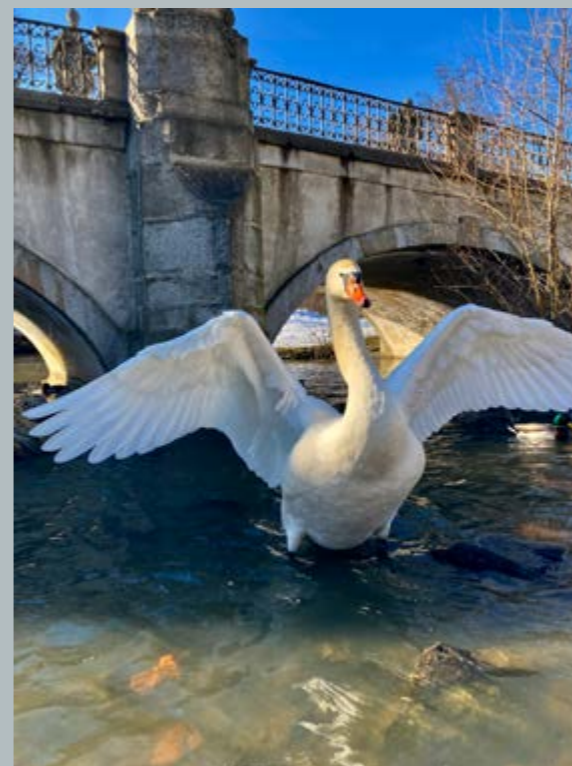
1. místo - Labuť v Zámku