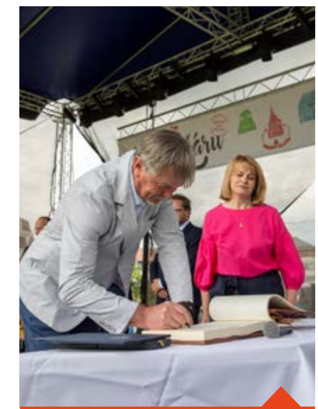
Cena města 2023

Každý návrh musí obsahovat jméno a příjmení navrhované osobnosti, popřípadě bydliště či jiné kontaktní údaje, jsou-li navrhovateli známy, dále odůvodnění návrhu v rozsahu minimálně půl normostrany (900 znaků). Navrhovatel musí uvést své jméno a příjmení (firmy uvedou název), adresu a kontaktní telefon, případně e-mail.