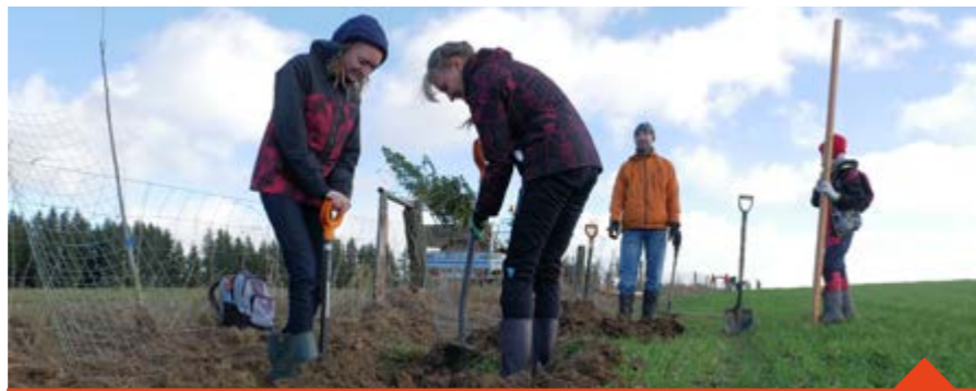
Staronovou polní cestu přišly osázet desítky dobrovolníků

„Samotné výsadbě předcházelo vyčištění úvozu od ulice Alšova a dalšího úseku směrem k hrází Bruknerova rybníka. Pak přišlo na řadu zaměření cesty, vytyčení míst pro výsad-