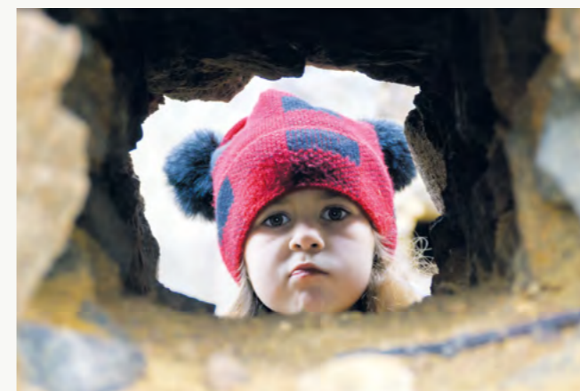
2. místo – Portrét ve zdi