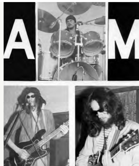
plakát Atomové mihule