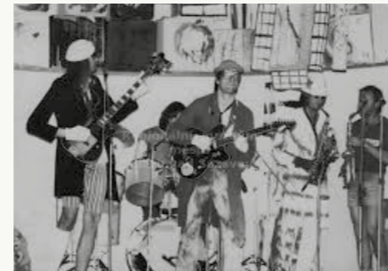
Mihule - pionýrský dům 1988

Kolem skupiny se časem vytvořilo společenství lidí stejné vůle, které se pravidelně scházelo ke společnému dílu. Většinou se jednalo o utajované akce, které se konaly pod záminkou nebo za účelem různých jmenin, narozenin či svateb. Skupina hrála také v Červeném mlýně u Honzy Šmída, kde se například objevila Mihule vedle Tata boys či Ivy Bittové.