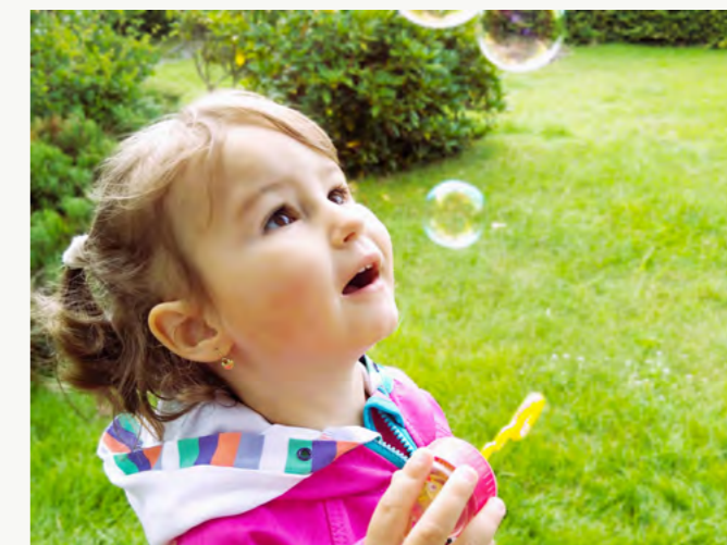
3. místo – Bublíny