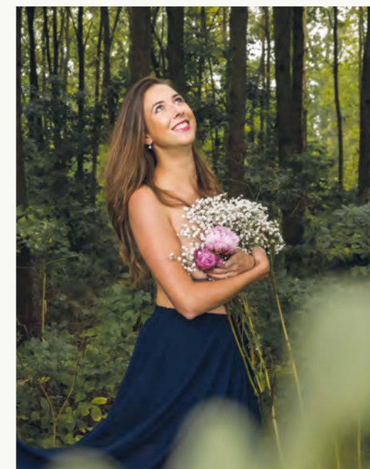
1. místo - Květiny