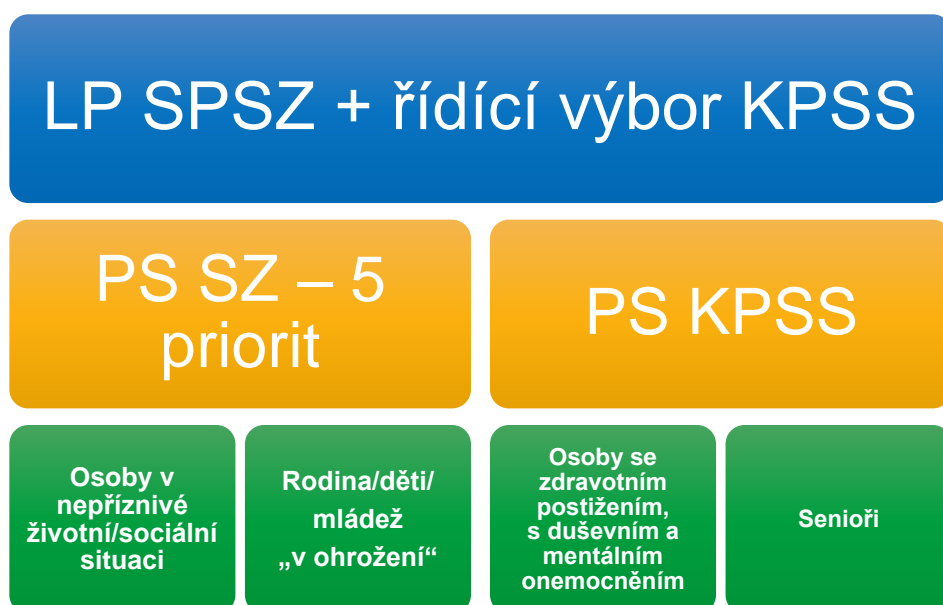
Schéma 2 Realizační struktura SPSZ

Řídící struktura přípravy tohoto dokumentu vychází z dosavadní praxe. Přípravu dokumentu Komunitní plán sociálních služeb monitoruje a schvaluje řídicí výbor, který se schází pravidelně 1x za čtvrt roku. Přípravu dokumentu Strategický plán sociálního začleňování II. řídí, monitoruje a schvaluje Lokální partnerství, které se schází min. 2x ročně. V rámci komunitního plánování kromě výše jmenovaných pracovních skupin, které byly včleněny pod pracovní skupinu sociální začleňování, probíhaly pravidelně pracovní skupiny pojmenované po prioritní cílové skupině „Senioři“ a pracovní skupina „Osoby se zdravotním postižením, duševním a mentálním onemocněním“. Závěrečné Lokální partnerství ke schvalování SPSZ II. bylo propojeno s řídicím výborem KPSS, aby byla potvrzena provazba mezi cíli a opatřeními.