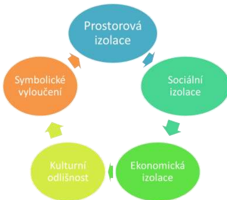
Obrázek 1 Sociální vyloučení

kontaktů mimo sociálně vyloučenou lokalitu. Základní charakteristikou propadu na sociální dno je nahromadění důvodů, které vedou k životní krizi (ztráta zaměstnání, platební neschopnost, problémy s bydlením, problémy dětí ve škole, nemoc atd.). Sociálně vyloučení lidé obvykle nestojí před jedním problémem, ale před jejich komplexem, přičemž mnohý z nich by i jednotlivě ohrožoval normální fungování člověka ve společnosti. S postupným propadem na dno přestává být zřejmé, co je původním důvodem propadu a co jeho následkem. Člověk se ocitá v tzv. pasti sociálního vyloučení. 2